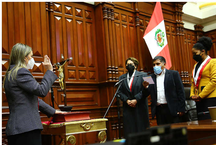
La señora congresista María del Carmen Alva presta el Juramento para asumir la Presidencia.