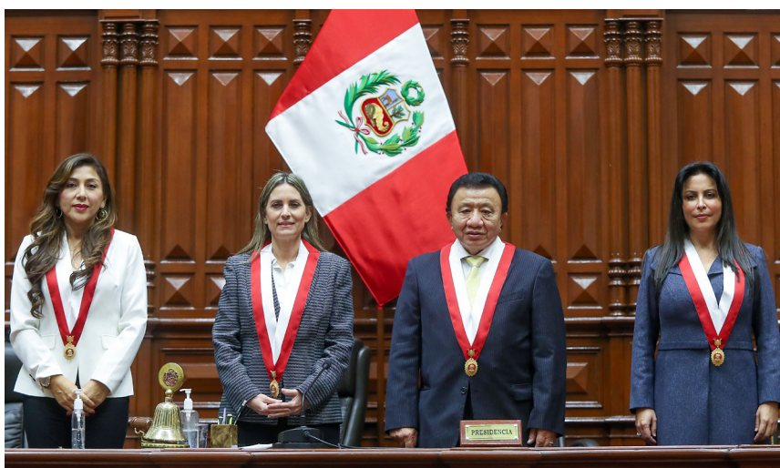
Mesa Directiva elegida para el periodo legislativo 2021 2022

La señora PRESIDENTA (María del Carmen Alva Prieto). — En observación el Acta.