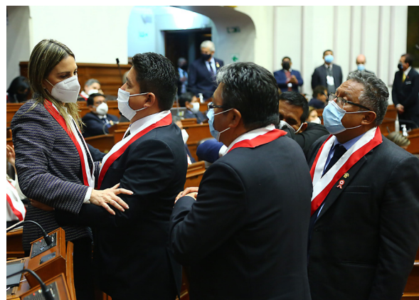
La señora congresista María del Carmen Alva recibe los saludos de los señores congresistas de la República