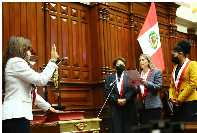
La señora congresista Lady Mercedes Camones Soriano presta el Juramento para asumir la primera Vicepresidencia.

La señora PRESIDENTA (María del Carmen Alva Prieto). — Señora congresista Lady Mercedes Camones Soriano, ¿jura usted, por Dios y por