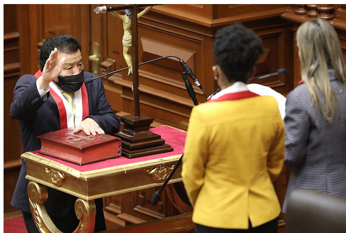
El señor congresista Enrique Wong Pujada presta el Juramento para asumir la segunda Vicepresidencia.

La señora PRESIDENTA (María del Carmen Alva Prieto). — Si así lo hace, que Dios