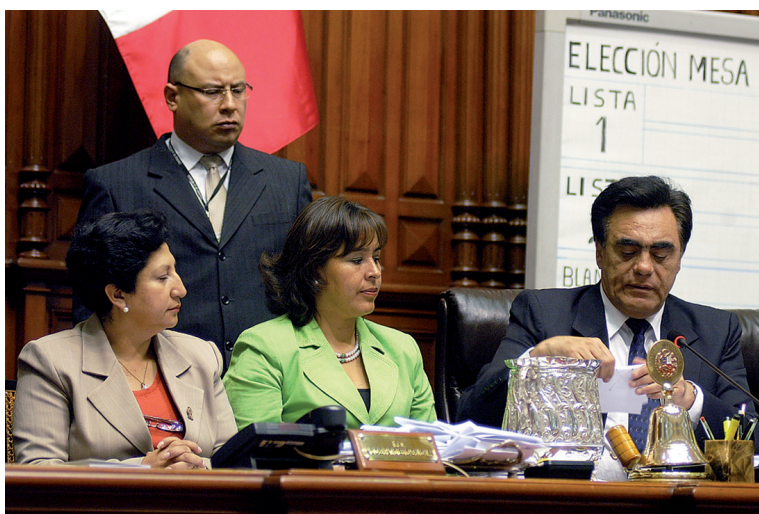
El señor Presidente, doctor Luis Gonzales Posada Eyzaguirre, efectúa el escrutinio en el proceso de elección de la Mesa Directiva 2008-2009.