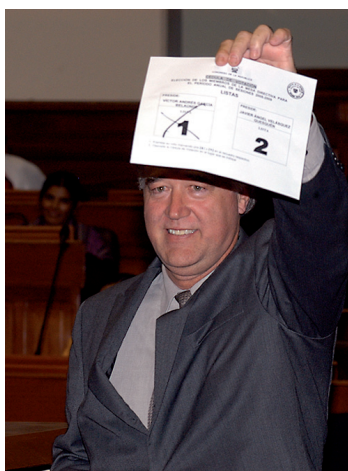
Los señores congresistas García Belaúnde y Velásquez Quesquén, candidatos a la presidencia del Congreso de la República, depositan su voto en el ánfora.