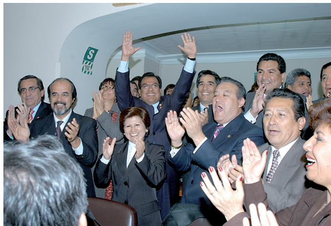
Entre aplausos, el doctor Javier Velásquez Quesquén agradece a sus colegas congresistas su designación como Presidente del Congreso.