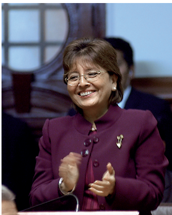
La congresista Fabiola Morales Castillo agradece su designación como Tercera Vicepresidenta del Congreso.