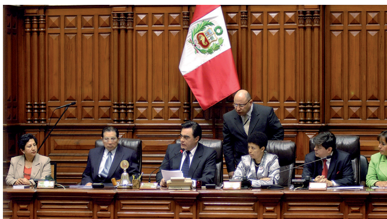
El señor Presidente del Congreso, acompañado de su Mesa Directiva en pleno y de las señoras escrutadoras del proceso de elección de la Mesa Directiva del período anual 2008-2009.

La lista número 2 está integrada por los siguientes congresistas: Javier Velásquez Quesquén, Presidencia; Alejandro Aguinaga Recuenco, Primera Vicepresidencia; Álvaro Gonzalo Gutiérrez Cueva, Segunda Vicepresidencia; y Fabiola María Morales Castillo, Tercera Vicepresidencia.