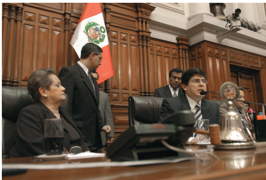
El Presidente de la Junta Preparatoria, congresista Carlos Torres Caro, preside la Sesión de Elección de Mesa Directiva para el período 2006-2007.

Es cierto que el artículo 12.º del mismo reglamento establece un procedimiento especial para la votación y la elección de la Mesa Directiva; pero esa disposición ha quedado tácitamente modificada por el artículo 57.º. No se puede entender de otra manera el artículo 57.º porque dice que todas las votaciones son públicas, y no señala excepción alguna. Por tanto, la votación para la elección de la Mesa Directiva tiene que ser pública, no secreta.