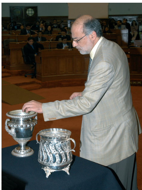
El congresista Daniel Abugattás deposita su voto en el ánfora.

El señor PRESIDENTE (Carlos Alberto Torres Caro). — Cerrada la votación.