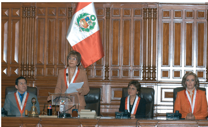
Discurso de la Presidenta del Congreso de la República, congresista Cabanillas Bustamante, luego de prestar juramento y asumir sus funciones.

El mandato parlamentario no puede ser sinónimo de impunidad. El primer interés del Congreso se centra en que quienes representen a la comunidad merezcan el encargo y el mandato que se les está confiando. El Congreso no puede avalar conductas ilícitas e inmorales privilegiando a los representantes sobre el resto de los mortales.