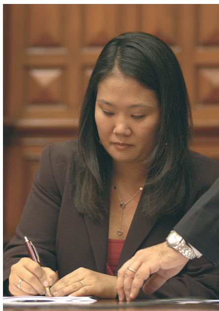
La congresista Keiko Sofía Fujimori Higuchi, que oficia de escrutadora, firma las cédulas de votación.