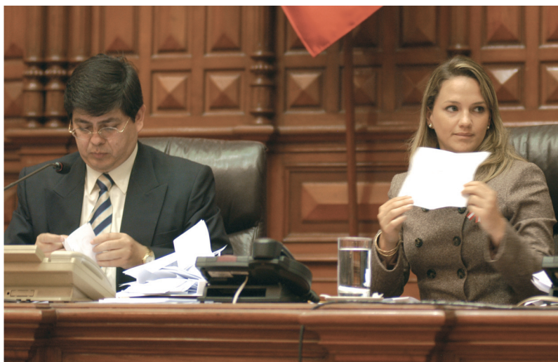
El Presidente de la Junta Preparatoria realiza el escrutinio.