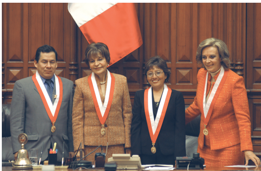
Mesa Directiva del Congreso de la República del período anual de sesiones 2006-2007.

Presidida por el congresista electo Carlos Alberto Torres Caro