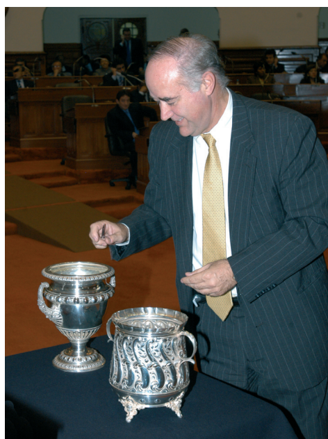
El congresista Andrés García Belaúnde deposita su voto en el ánfora.