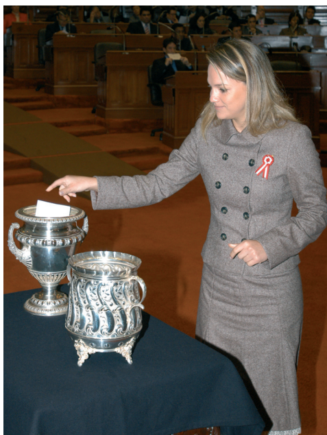
La congresista Luciana León Romero deposita su voto en el ánfora.

—El RELATOR llama a cada uno de los miembros de la Mesa Directiva de la Junta Preparatoria, quienes reciben su cédula de sufragio, expresan en ella su voto y luego la depositan en el ánfora.