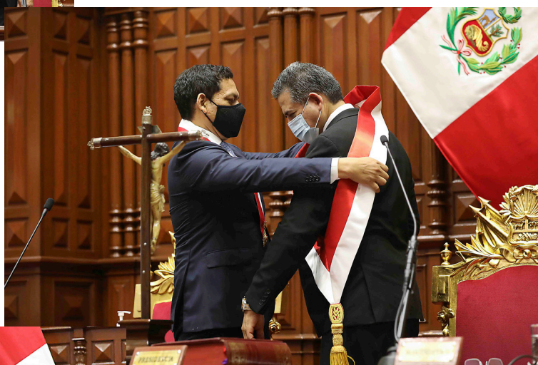
El señor Presidente del Congreso, Luis Alberto Valdez Farías, coloca la banda presidencial al señor Presidente de la República, Manuel Arturo Merino de Lama.