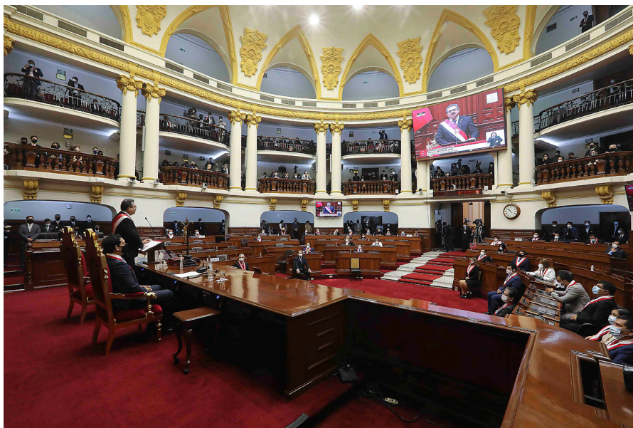
El Pleno del Congreso escucha el discurso del señor Presidente de la República, Manuel Arturo Merino de Lama.

de apoyarme, los que votaron por nosotros y los que no votaron. Porque hemos hecho una familia en un corto plazo, una familia que forma parte de la historia de mi vida.