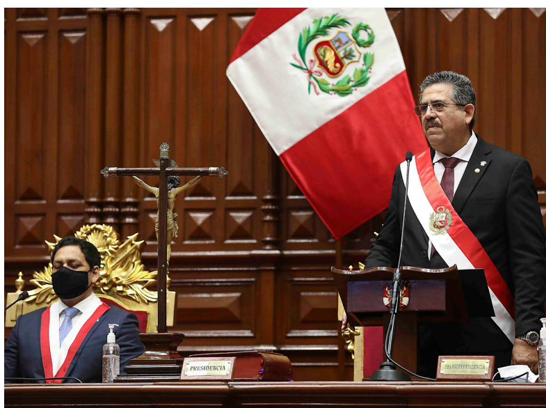
El señor Presidente de la República, Manuel Arturo Merino de Lama, dirige su discurso al Pleno del Congreso.

Reactivación económica y empleo: Nuestro país necesita también continuar con la reactivación económica y el relanzamiento de la economía.