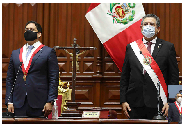
El señor Presidente del Congreso, Luis Alberto Valdez Farías, junto con el señor Presidente de la República, Manuel Arturo Merino de Lama, entonan las sagradas notas del himno nacional.

El señor PRESIDENTE (Luis Alberto Valdez Farías). — Invito al señor Presidente de la República, Manuel Arturo Merino de Lama, a dirigir su mensaje al Congreso.