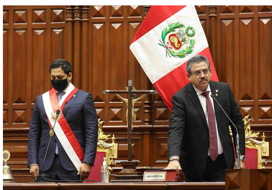
El señor Manuel Arturo Merino de Lama presta juramento al cargo de Presidente de la República.