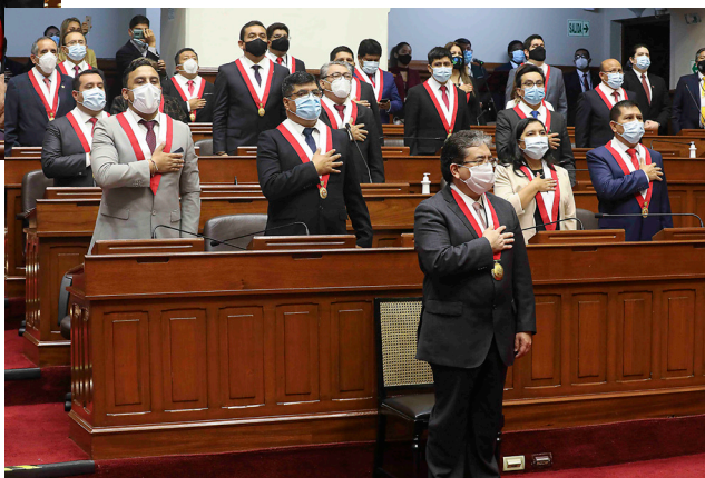
Los asistentes a la ceremonia de juramentación entonan de pie las sagradas notas del himno nacional.