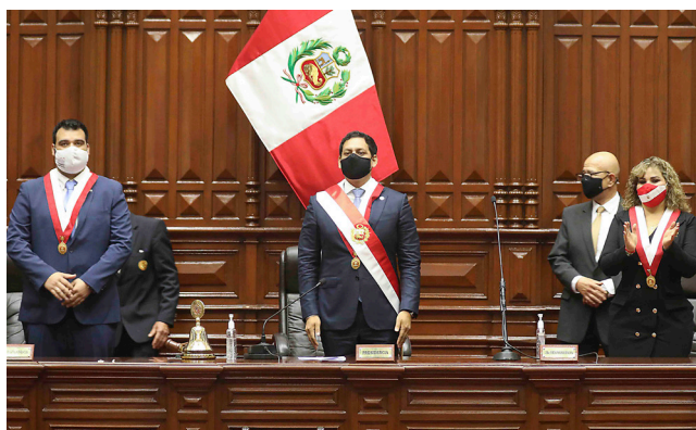
El señor Presidente del Congreso, Luis Alberto Valdez Farías, recibe de manos del oficial mayor la banda presidencial.

El señor PRESIDENTE (Luis Alberto Valdez Farías). — La Presidencia solicita a los vicepresidentes, Guillermo Aliaga Pajares y María Teresa Cabrera Vega, que inviten al señor Manuel Arturo Merino de Lama, Presidente del Congreso de la República, al hemiciclo de sesiones, para que asuma las funciones de Presidente de la República mediante juramento.