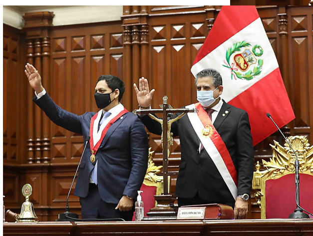
El señor Presidente de la República, Manuel Arturo Merino de Lama, saluda a los miembros presentes en el hemiciclo.