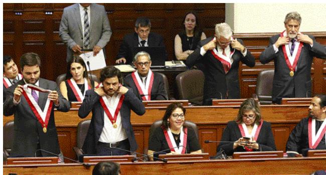
Los señores congresistas electos se colocan sus respectivas medallas que los identifica como congresistas de la república.