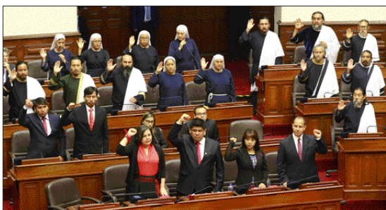
Los señores congresistas electos que conforman el primer grupo juran el cargo que desempeñarán para completar el período parlamentario 2016-2021.