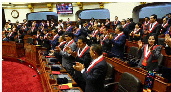
La sala prorrumpe en aplausos luego de concluir el acto de juramentación e incorporación de los nuevos congresistas.