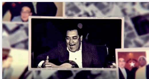
Figura 1. Óscar Guillermo Avilés Arcos, guitarrista, cantor, compositor, arreglista y productor discográfico.

(Acompañan la sucesión de fotos los vales «Contigo Perú», «Cuando llora mi guitarra» y «Cariño bonito»).