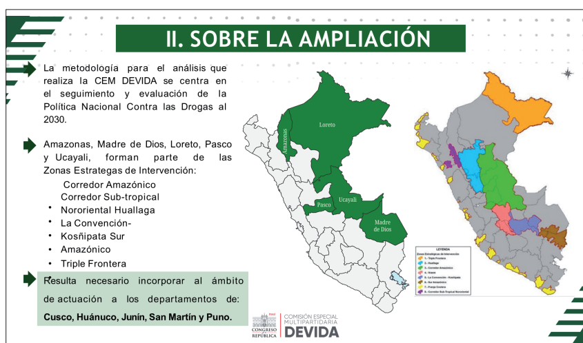
Figura 3. Ámbito de actuación de la Comisión Especial Multipartidaria DEVIDA.

Y, al día de hoy, presidente, resulta necesario incorporar, al ámbito de actuación, a los departamentos de Cusco, Huánuco, Junín, San Martín y Puno, por las siguientes consideraciones. (Ver figuras 3 y 4).