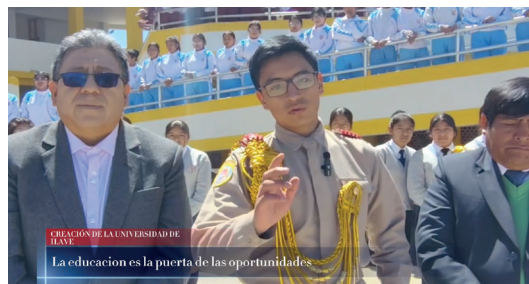
CREACIÓN DE LA UNIVERSIDAD DE ILAVE La educación es la puerta de las oportunidades

El presentador .— Hoy más que nunca es urgente crear la Universidad Nacional de Ilave, para que nuestros jóvenes no tengan que migrar en busca de un futuro, para que la educación llegue donde más se necesita.