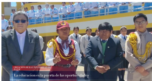
CREACIÓN DE LA UNIVERSIDAD DE ILAVE La educación es la puerta de las oportunidades

El participante 1.— Cuento con ustedes y con cada uno de los peruanos para que se pueda crear la Universidad Nacional de Ilave.