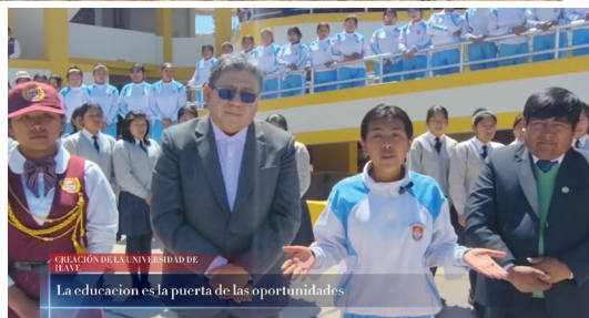
CREACIÓN DE LA UNIVERSIDAD DE ILAVE La educación es la puerta de las oportunidades