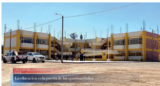
CREACIÓN DE LA UNIVERSIDAD DE ILAVE La educación es la puerta de las oportunidades