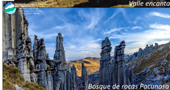
Bosque de rocas Pacunasa