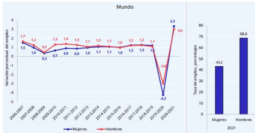
Gráfico 4. Variación porcentual del empleo por género, 2006-2021 y tasa de ocupación, 2021

Fuente: OIT. Avanzar en la reconstrucción con más equidad