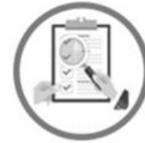
Procedimientos Parlamentarios de Control Político