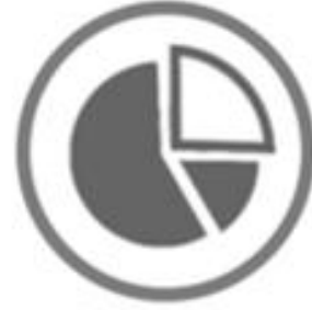
Congreso en cifras