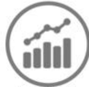
Área de Estadística Parlamentaria