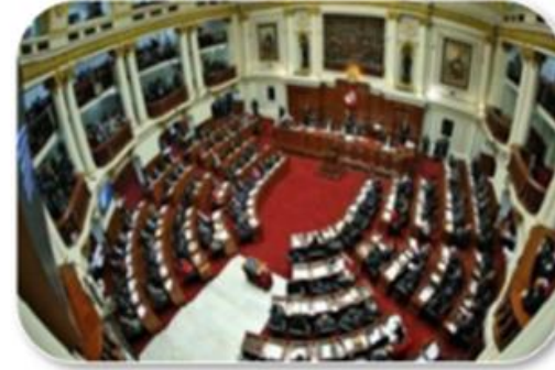
Marco normativo y Leyes para el Año Fiscal 2024