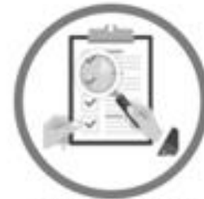
Procedimientos Parlamentarios de Control Político