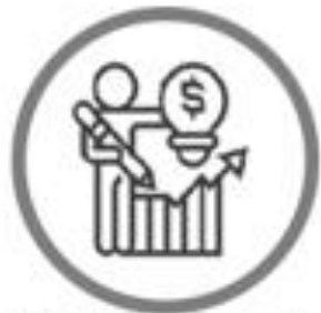
Materiales sobre el Presupuesto Público del Año Fiscal 2023