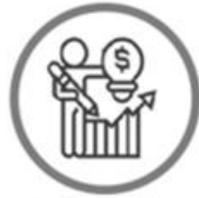
Materiales sobre el Presupuesto Público del Año Fiscal 2023