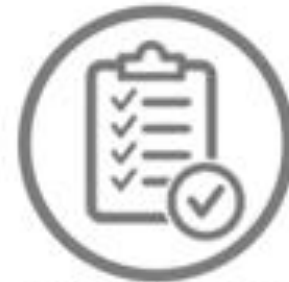
Información sobre Procedimientos Parlamentarios