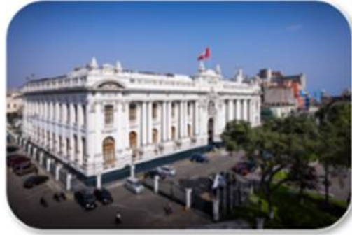
Proyectos de Ley y Dictámenes