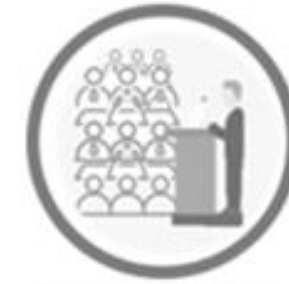
Concurrencia de altos funcionarios al Congreso