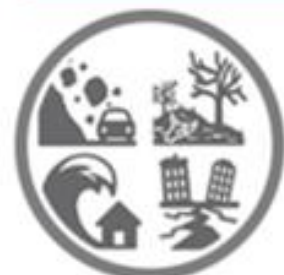
Emergencias por fenómenos naturales, sanitarios y antrópicos