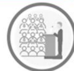
Concurrencia de altos funcionarios al Congreso