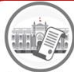
Autógrafas de Ley remitidas al Poder Ejecutivo