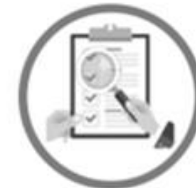
Procedimientos Parlamentarios de Control Político