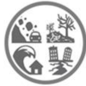
Emergencias por fenómenos naturales, sanitarios y antrópicos