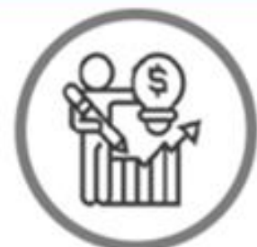
Materiales sobre el Presupuesto Público del Año Fiscal 2023