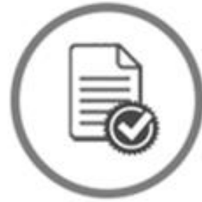
Informes y Reportes Temáticos