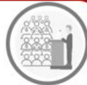
Concurrencia de altos funcionarios al Congreso