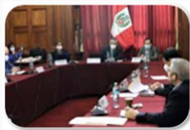
Desarrollo con equidad y justicia social