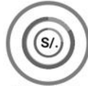
Seguimiento al Gasto Público