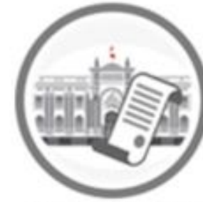
Autógrafas de Ley remitidas al Poder Ejecutivo