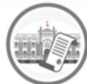
Autógrafas de Ley remitidas al Poder Ejecutivo