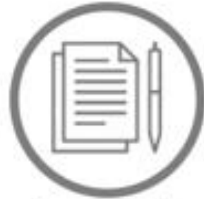
Leyes pendientes de Reglamentar