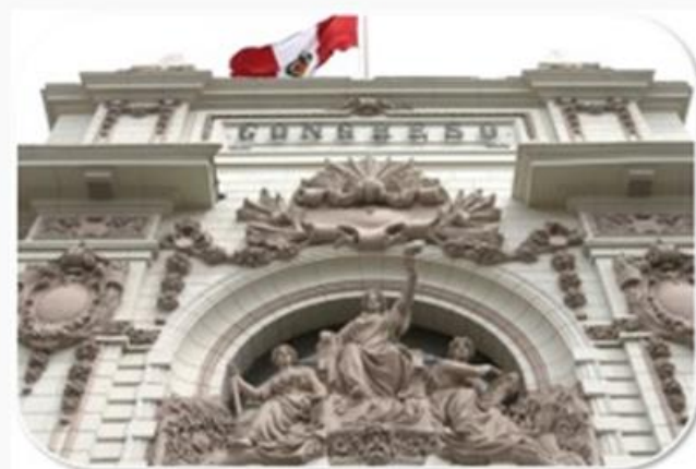
Fortalecimiento de la Democracia y del Estado de Derecho