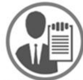
Entidades obligadas a informar