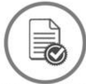
Informes y Reportes Temáticos