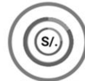
Seguimiento al Gasto Público