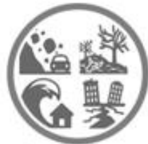
Emergencias por fenómenos naturales, sanitarios y antrópicos