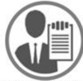
Entidades obligadas a informar