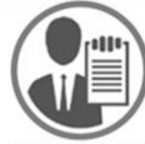
Entidades obligadas a informar