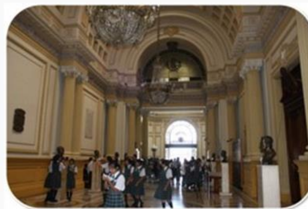
Afirmación de un Estado eficiente, transparente y descentralizado