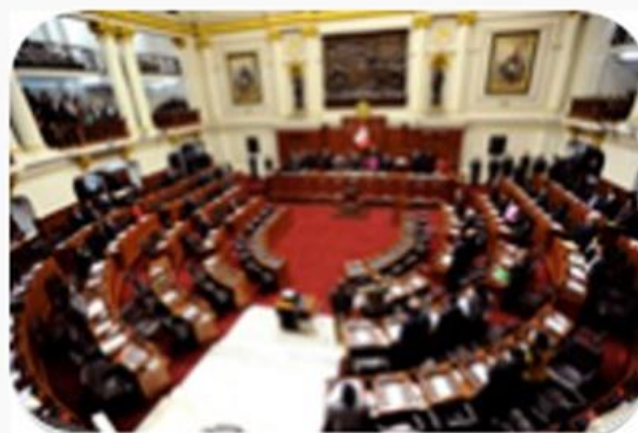
Promoción de la competitividad del país