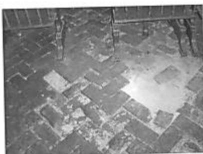
Piso de Sala de Audiencias altamente dañado. Piezas de 20x10cm

En la Sala de Audiencias el piso de ladrillos cocidos rectangulares, ha sido dispuesto en forma de espina de pescado. Este piso presenta un alto tránsito debido al circuito turístico que se desarrolla por años. Se observa también que el mantenimiento actual de encerado a las unidades ha generado un tipo de "encharolamiento" que provoca una textura y color distinto al original. Además se aprecia un desnivel provocado por el movimiento del falso piso. Lo mismo ocurre en el Cuarto del Secreto pero en menor proporción.