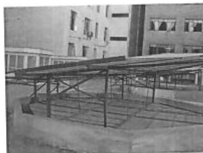
Existen 02 paneles de vidrio ubicados encima de cada vitral soportados con estructura.

Este servicio consiste en realizar las siguientes partidas: