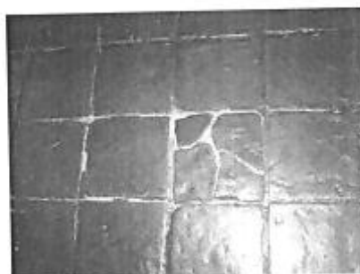
Piso de Cuarto del Secreto algunas piezas dañadas de 25x25cm.