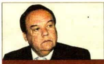
Luis Alva Castro (*)

El Presupuesto del sector público para el año 2010 expresado en el Dictamen de la Comisión de Presupuesto y Cuenta General de la República, asciende a S/. 82,107 millones, que representan alrededor del 20% del Producto Bruto Interno (PBI) del país y que es 13% por encima de lo presupuestado para el presente año.