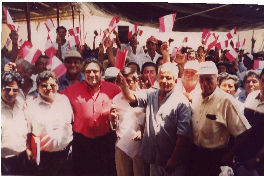
Reunión para analizar la problemática agraria con los productores agropecuarios de San Lorenzo.