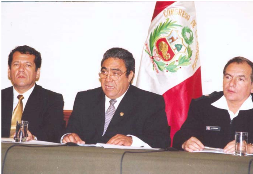
El Presidente del PARLAMAZ junto con especialistas explicando las bondades de los teleféricos como una alternativa vial para la geografía agreste del proyecto de la vía interoceánica Perú-Brasil, proponiendo su construcción al Poder Ejecutivo.