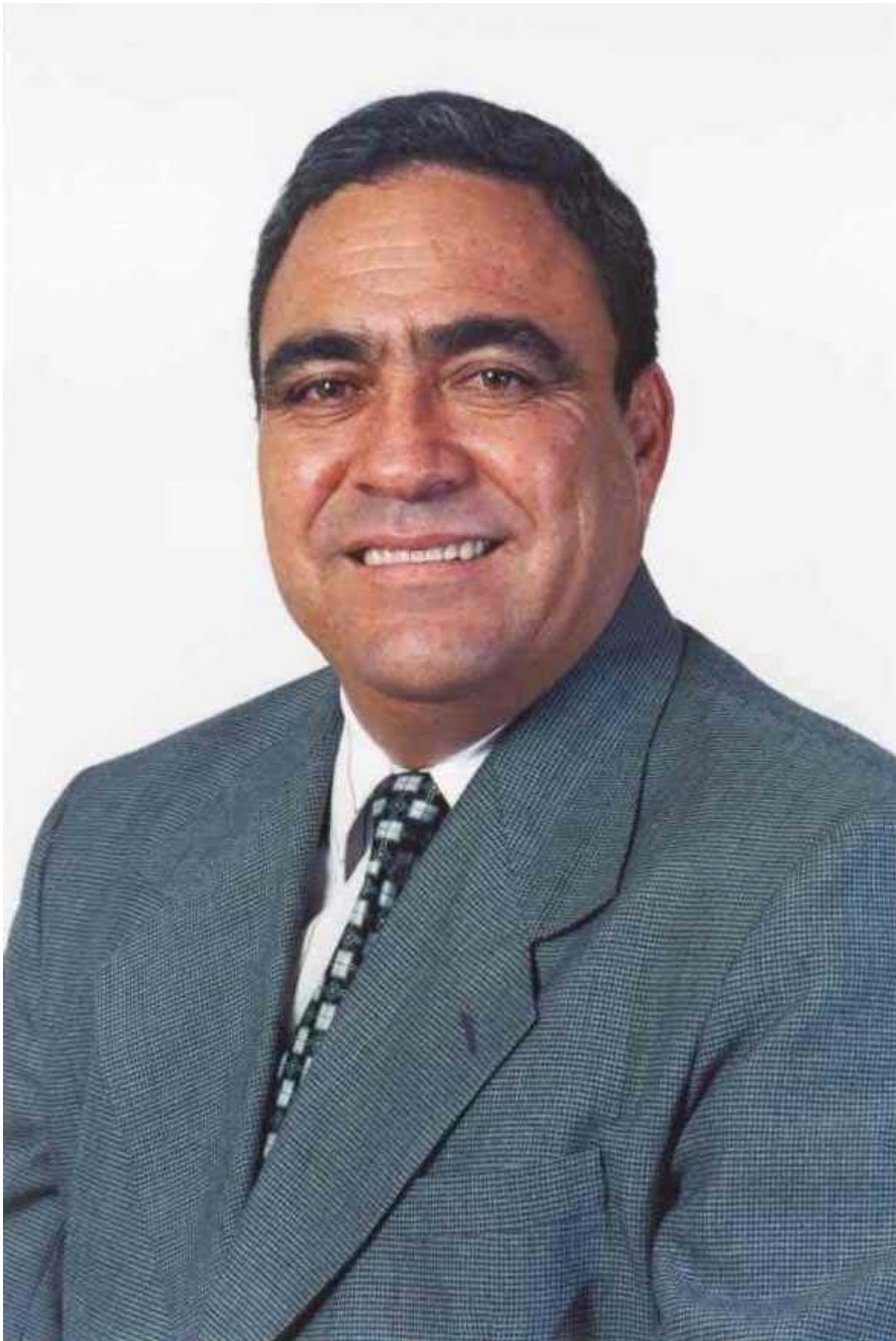
GERARDO SAAVEDRA MESONES Congresista de la República