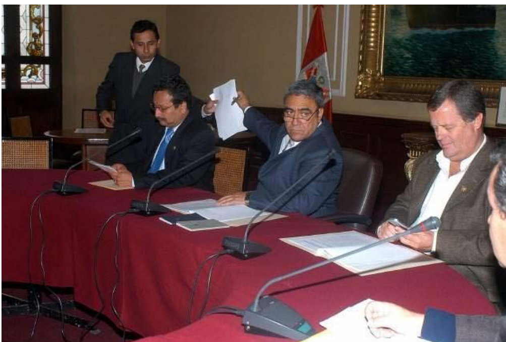
El congresista Gerardo Saavedra preside el grupo de trabajo de la Comisión de Fiscalización y Contraloría creado para investigar la denuncia por la baja productividad de la semilla del algodón Híbrido Hazera 1952, que ha originado una grave problemática a los agricultores del departamento de Lambayeque.