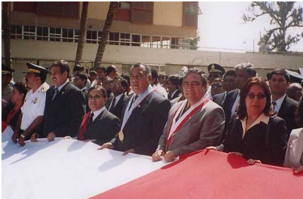
Participando en un acto cívico con las principales autoridades de la Región Lambayeque, con quienes celebró reuniones periódicas para la coordinación de obras y acciones de asistencia social.