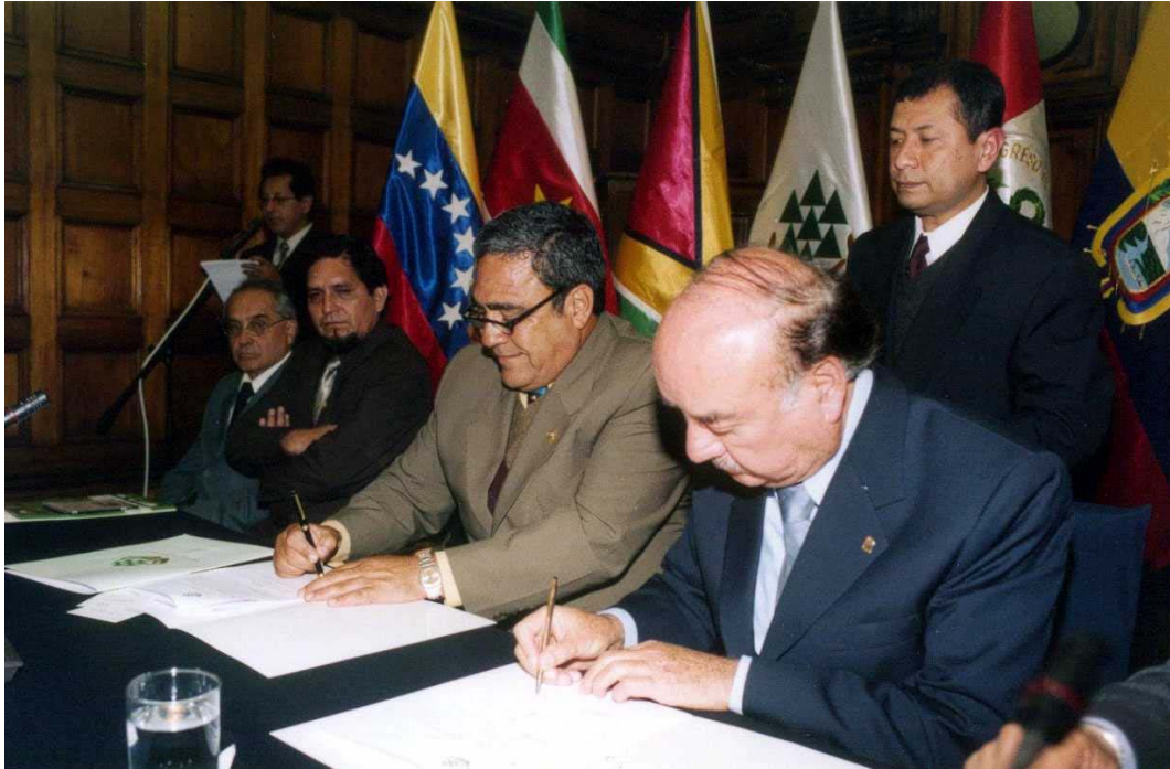
Suscripción del Convenio Marco entre el Parlamento Amazónico (PARLAMAZ) y el Instituto Nacional de Desarrollo (INADE) para el desarrollo de proyectos en beneficio de la Amazonia