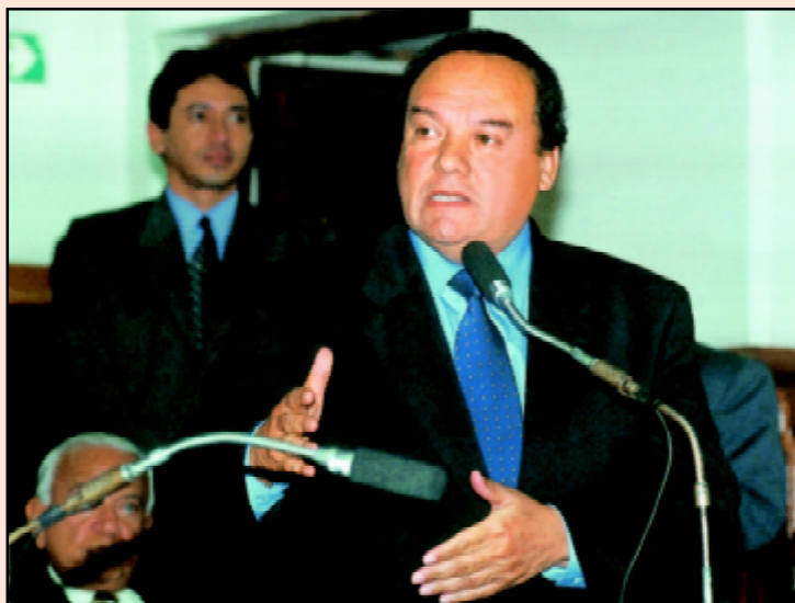
Luis Alva Castro, Presidente de la Comisión de Economía, sustentando ante el Pleno del Congreso el dictamen dirigido a modificar el D.U. N° 060-2001