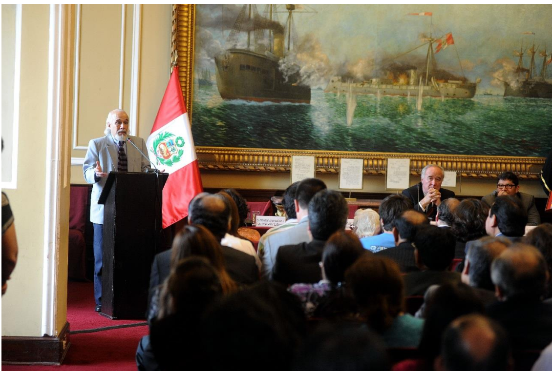
Presentación de obra de César Delgado Para la representación de la República (2012)

Asimismo, ha publicado numerosos artículos especializados, entre ellos: