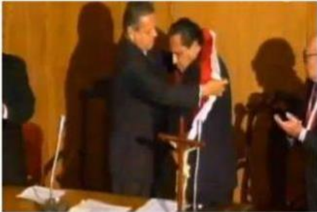
Juramentación de Máximo San Román como Presidente Constitucional de la República 1 .

Uno de los hitos más importantes en el desarrollo de la carrera de César Delgado Guembes en el Servicio Parlamentario fue su determinación de apoyar al Congreso disuelto como consecuencia del autogolpe del 5 de abril de 1992. En esa ocasión, ocupando el cargo de Sub Oficial Mayor de la Cámara de Diputados y del Congreso, formó parte de un reducido grupo de funcionarios y trabajadores que asumieron de modo incondicional el riesgo de mantener lealtad a los principios republicanos de la Constitución peruana, en las sesiones que clandestinamente se llevaban a cabo para declarar la vacancia de la presidencia del ingeniero Alberto Fujimori y su reemplazo por el ingeniero Máximo San Román. El Presidente de la Cámara de Diputados, don Roberto Ramírez del Villar, le encomendó la custodia de la documentación tramitada durante ese período. Luego de nueve años de separación del Servicio Parlamentario su retorno fue consecuencia de la convocatoria que le formulara el Presidente del Congreso Carlos Ferrero Costa en setiembre del año 2002.