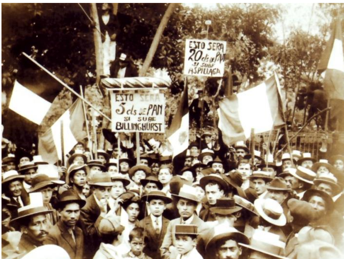
Campaña electoral de 1912: El "Pan Grande" (Billinghurst) 3

industriales y adquirió nuevas maquinarias para Cayaltí, a la que convirtió en una de las principales negociaciones azucareras del país.