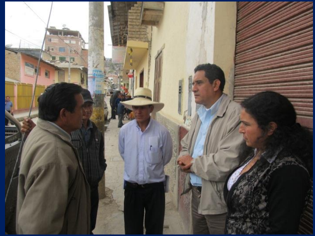
Reunión con autoridades y vecinos de Bambamarca para conocer su problemática.