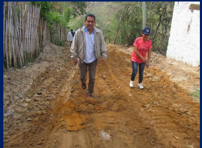
Supervisión de la trocha carrozable de Chimban a Pión