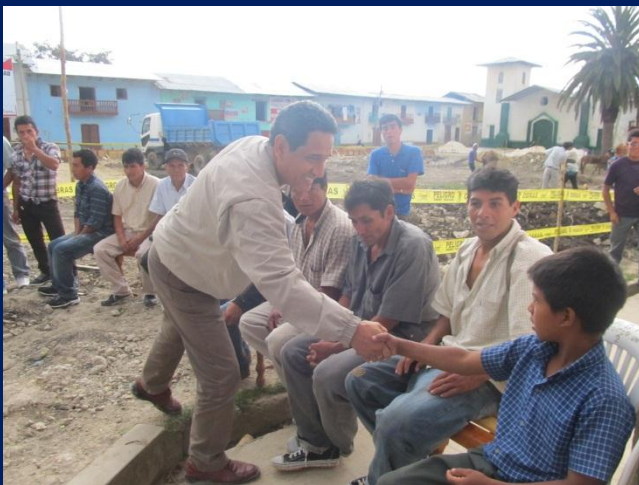
Saludando a pobladores del Distrito de Pión antes de dar a conocer la gestión realizada junto a sus autoridades en favor de la construcción del parque principal y carretera de acceso luego de años de postergación.