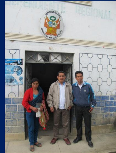
Junto al gobernador de San Luis de Lucma (Cutervo)