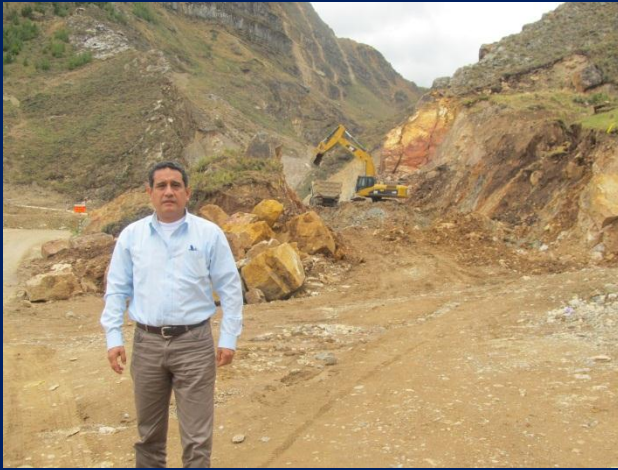
Supervisión de la carretera Yanacocha – Bambamarca.