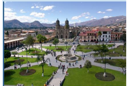
Cajamarca, la bella: A 158 años de su creación