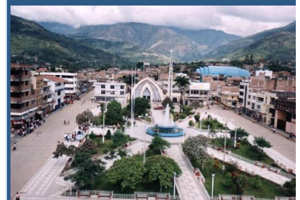
Histórica provincia de Jaén, Departamento de Cajamarca.