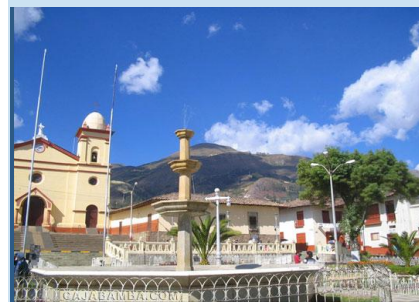
Cajabamba, La Gloriabamba de Bolívar