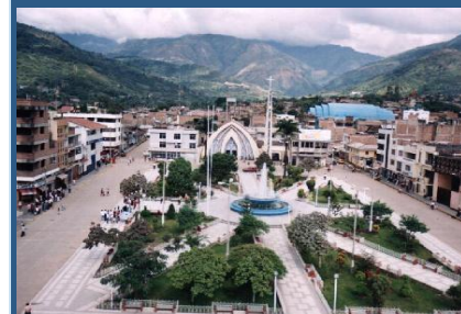
Histórica provincia de Jaén, Departamento de Cajamarca