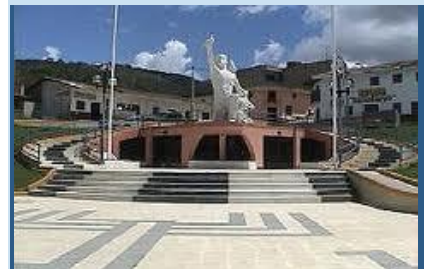
Santa Ignacio, "Tierra del más rico Café y miel de abeja".