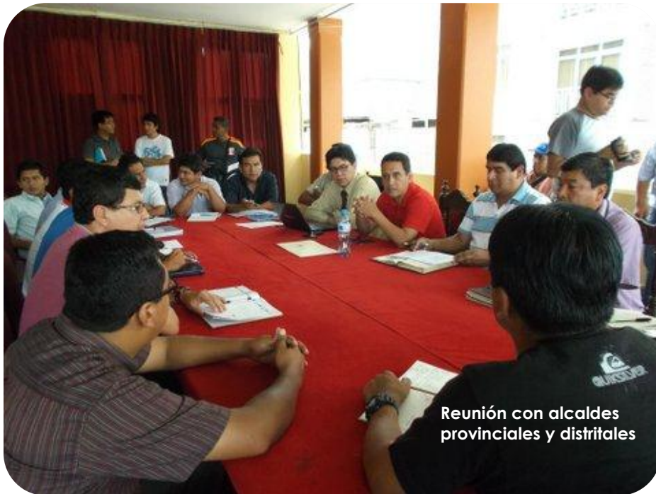
Reunión con alcaldes provinciales y distritales

El Congreso de la República aprobó la Ley que declara de Interés Nacional la Promoción de la Ciencia, la Innovación y la Tecnología a través de las Asociaciones Público – Privadas (Sesión de Pleno del 15.12.12).