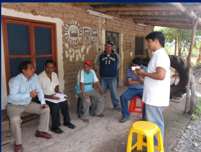
Reunión con pobladores del sector Palo Blanco, distrito de Pucará (Jaén).