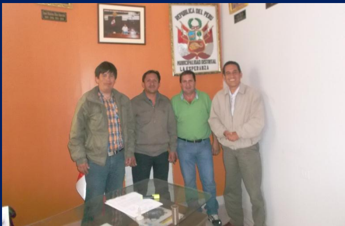
Reunión de trabajo con el alcalde y autoridades del distrito de La Esperanza (Santa Cruz).