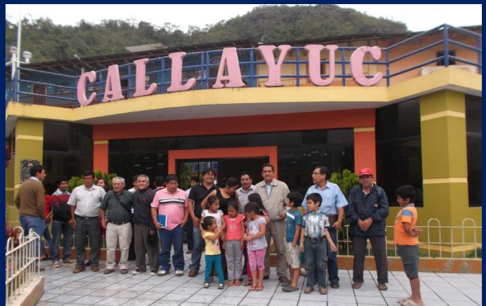
Reunión con autoridades y pobladores del distrito de Callayuc (Cutervo).