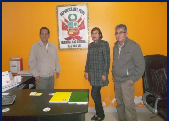
Reunión con autoridades de la Municipalidad Distrital de Yauyucan (Santa Cruz).