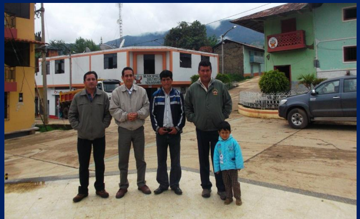
Reunión de trabajo con autoridades de Ninabamba, provincia de Santa Cruz.