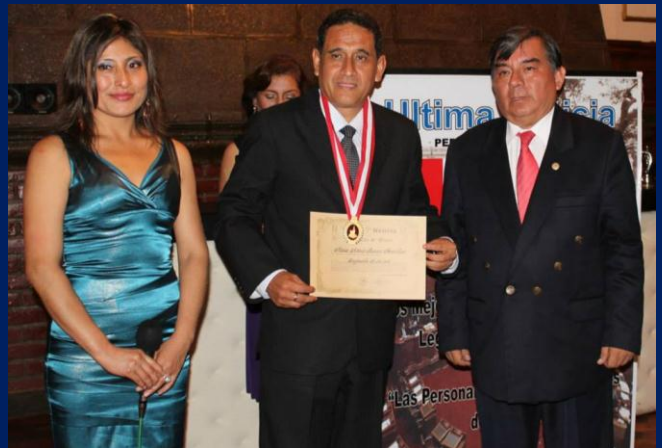
Congresista Mesías Guevara premiado con el "Esaño de Oro" por el Periódico Parlamentario "Últimas Noticias".