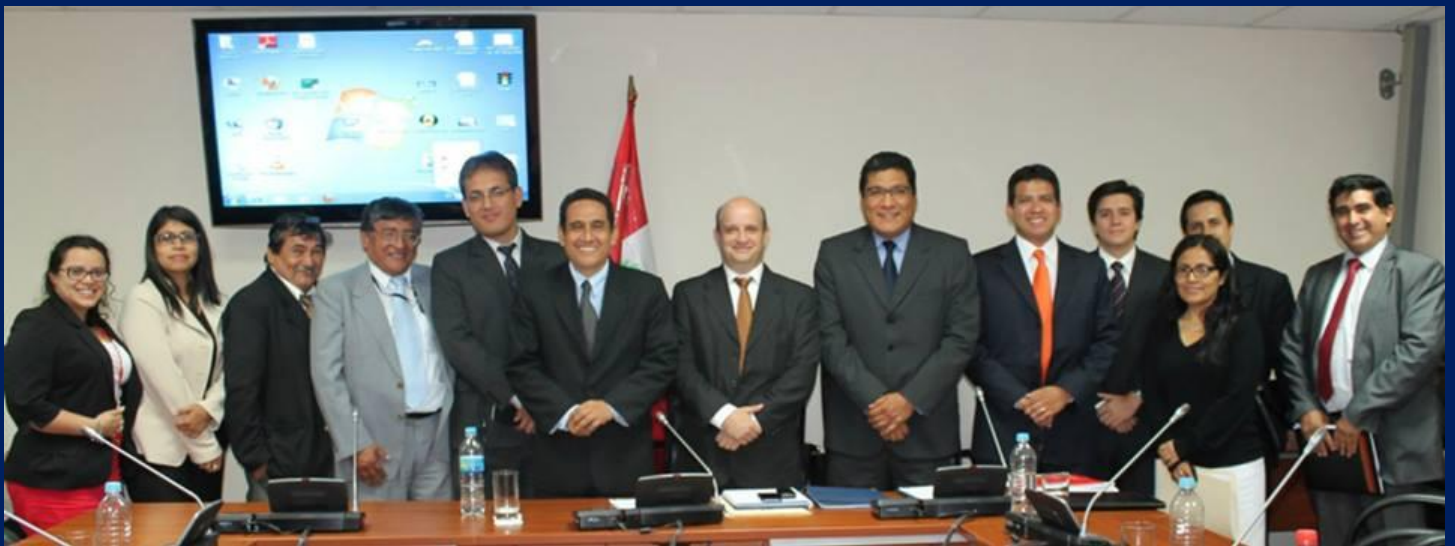
Grupo de Trabajo: Ley General de Telecomunicaciones. Aquí junto a los representantes del Ministerio de Transportes y Comunicaciones, Ministerio de Economía, FTEL y OPSITEL.