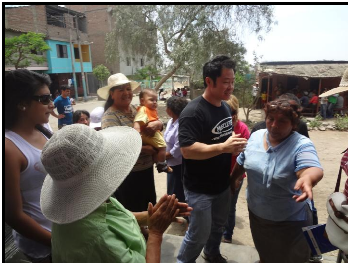
Villa María del Triunfo

En cumplimiento de lo establecido en el artículo 23º del Reglamento del Congreso de la República, durante las semanas de representación establecidas, he cumplido con constituirme en la circunscripción electoral a la que pertenezco, realizando, de esta manera, visitas a los Asentamientos Humanos – AA.HH. ubicados en las zonas más alejadas y olvidadas de Lima, tales como el AA.HH. Santa María de Ate Vitarte, Villa Limatambo Zona José Carlos Mariátegui de Villa María del Triunfo, Portada del Sol – Nueva Rinconada de San Juan de Miraflores, Huascata de Chaclacayo, Asociación Valle Hermoso El Mirador, sector Lomas de Carabayllo, entre otros.