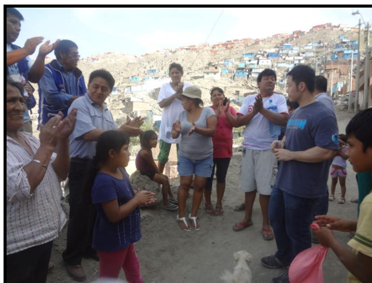
Santa María de Ate