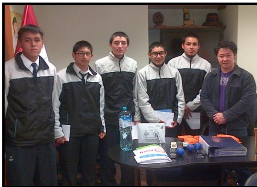
Alumnos del Colegio Salesiano de Breña