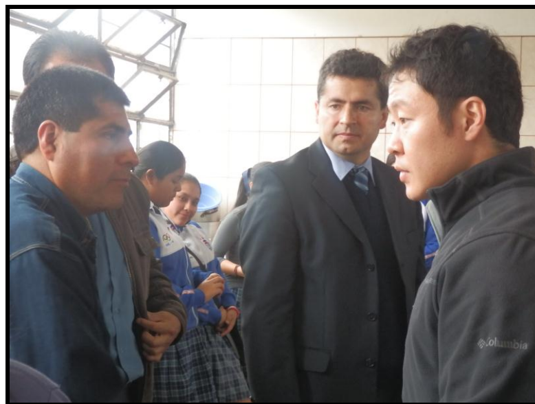
I.E. Francsico Bolognesi