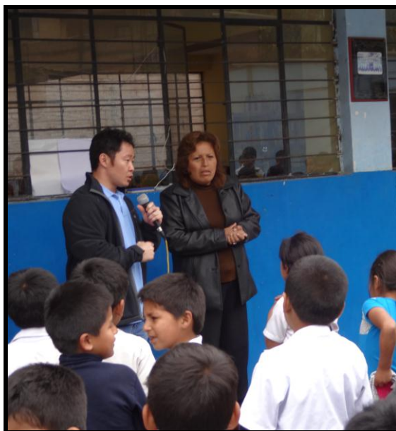
I.E. Santa María de Ate

"AÑO DE LA PROMOCIÓN DE LA INDUSTRIA RESPONSABLE Y DEL COMPROMISO CLIMÁTICO"