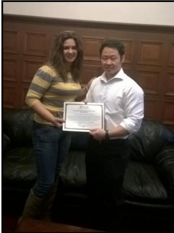
Entrega de Becas de Estudio

"AÑO DE LA PROMOCIÓN DE LA INDUSTRIA RESPONSABLE Y DEL COMPROMISO CLIMÁTICO"