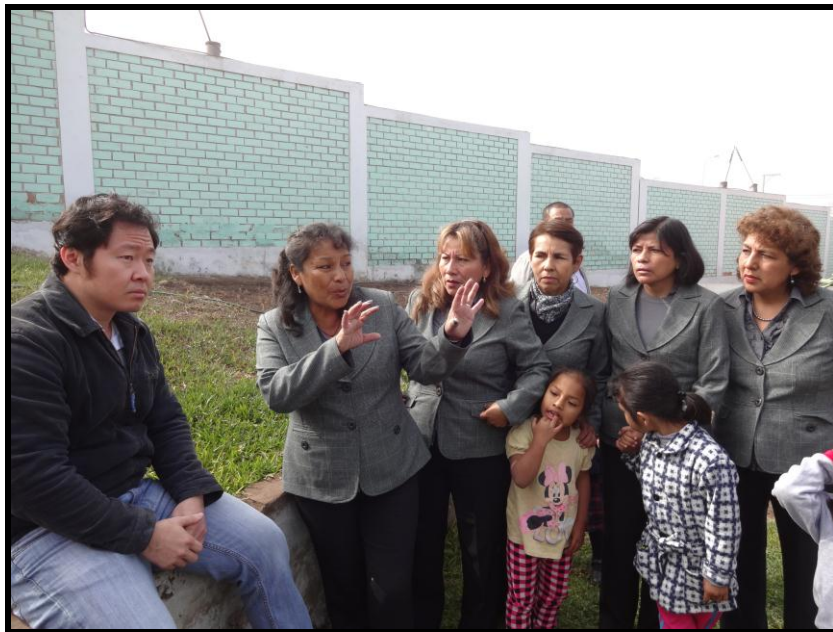
I.E Inicial N° 1161

"AÑO DE LA PROMOCIÓN DE LA INDUSTRIA RESPONSABLE Y DEL COMPROMISO CLIMÁTICO"