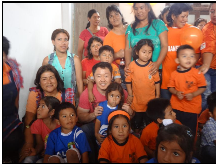
I.E. San Martín de Porres