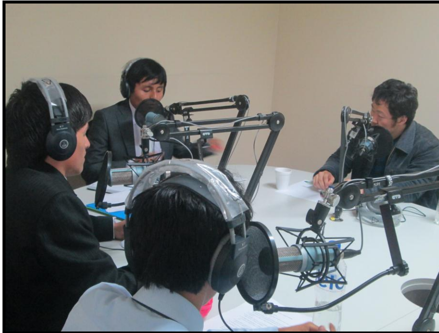
Alumnos de la Universidad César Vallejo – Cono Norte

"AÑO DE LA PROMOCIÓN DE LA INDUSTRIA RESPONSABLE Y DEL COMPROMISO CLIMÁTICO"