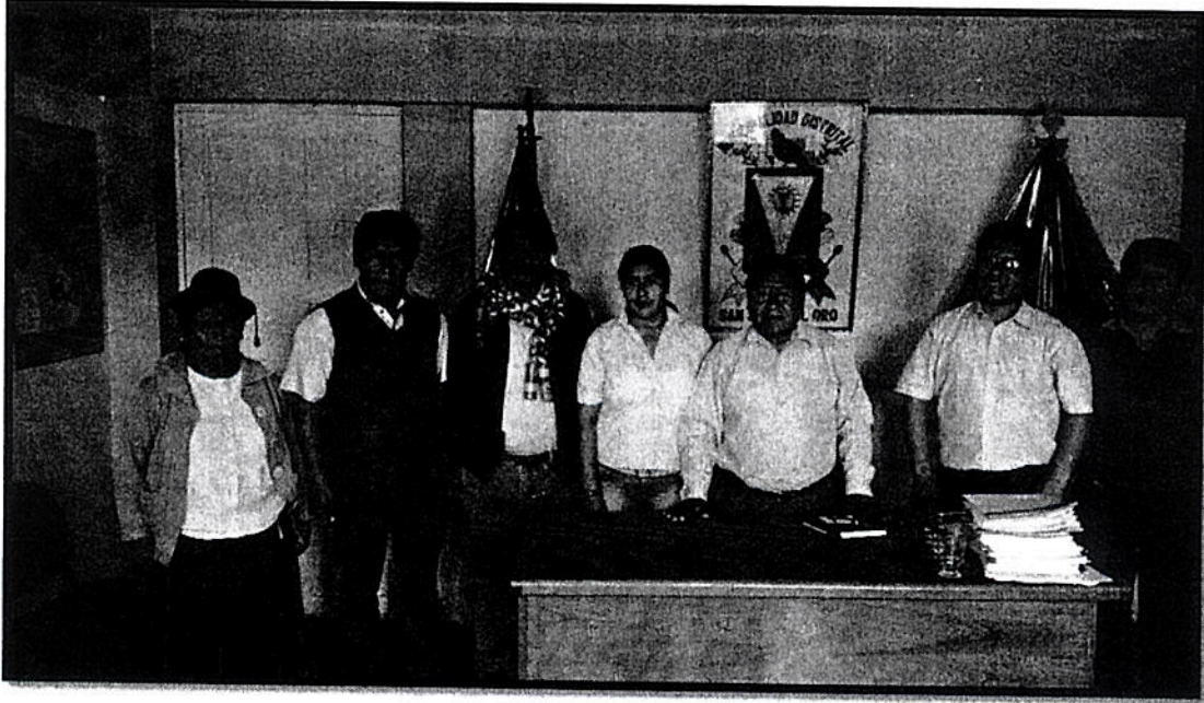
Fotografía 07: Visita al Distrito de San Juan del Oro, Provincia de Sandia – Puno

"Año de la Inversión para el Desarrollo Rural y la Seguridad Alimentaria"