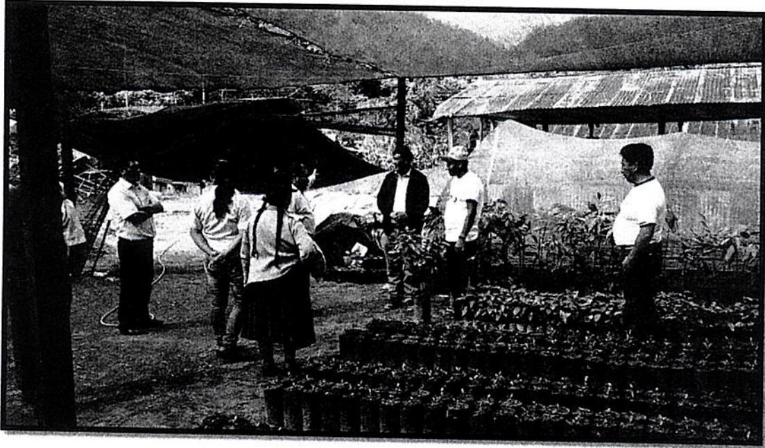
Fotografía 09: Visita al Vivero Municipal de Challuma en San Juan del Oro, Provincia de Sandía – Puno

"Año de la Inversión para el Desarrollo Rural y la Seguridad Alimentaria"