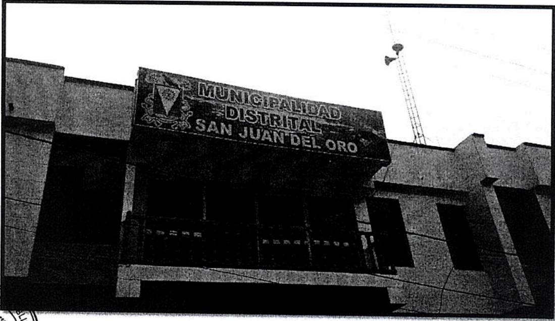
Fotografía 05: Visita al Distrito de San Juan del Oro, Provincia de Sandía - Puno

"Año de la Inversión para el Desarrollo Rural y la Seguridad Alimentaria"