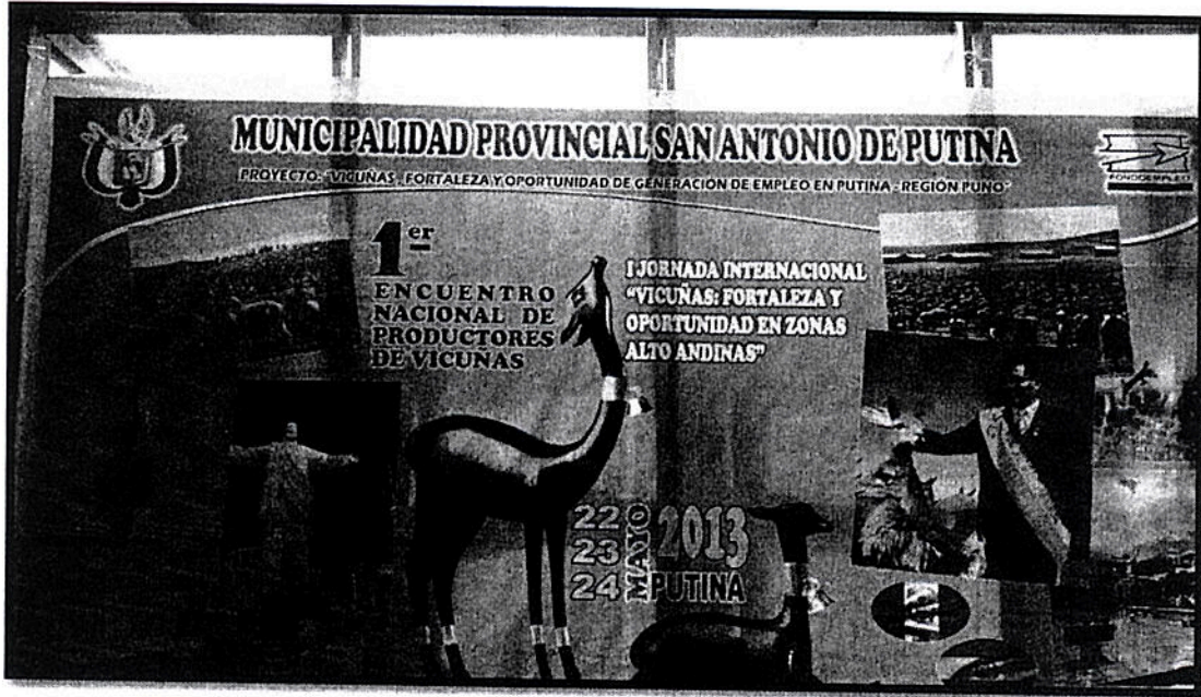
Fotografía 01: Encuentro de Productores de Vicuñas – San Antonio de Putina

"Año de la Inversión para el Desarrollo Rural y la Seguridad Alimentaria"