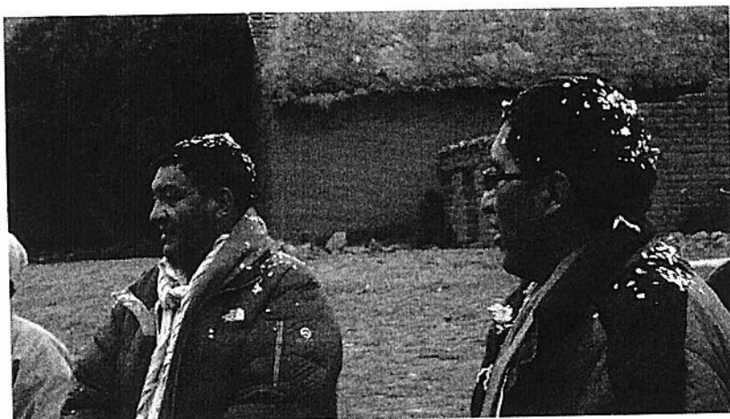
Visita a la Institución Educativa 72370 Altos Huayrapata

“Año de la integración nacional y el reconocimiento de nuestra diversidad”