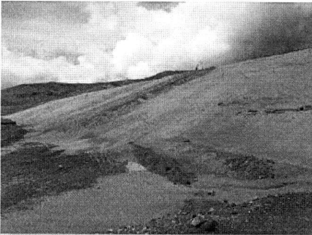
Gran cantidad de relave minero que se formó desde hace 14 años, donde en los años 2004 y 2007 se desbordaron generando una terrible contaminación