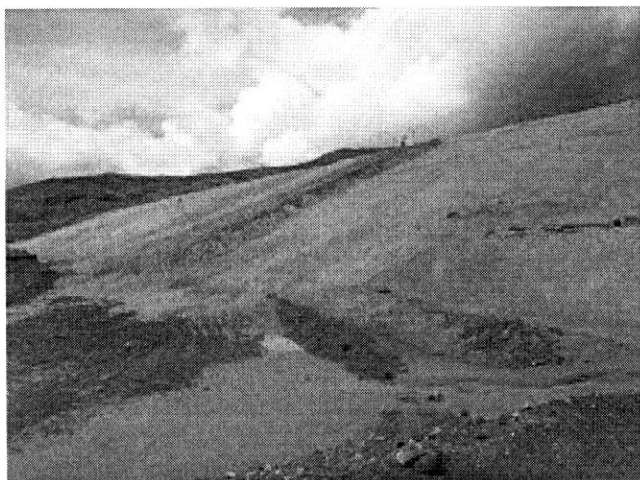
Gran cantidad de relave minero que se formó desde hace 14 años, donde en los años 2004 y 2007 se desbordaron generando una terrible contaminación