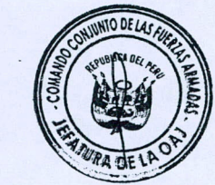
EDUARDO VEGA LUNA Ministro de Justicia y Derechos Humanos