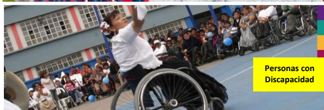
Personas con Discapacidad