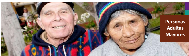
Personas Adultas Mayores