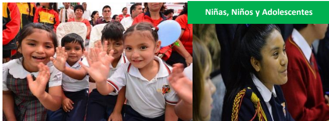
Niñas, Niños y Adolescentes