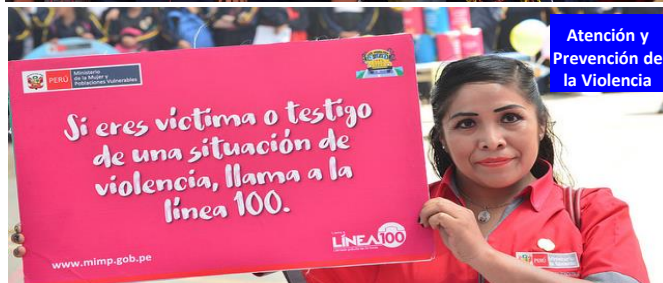
Atención y Prevención de la Violencia