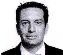
17. TORRES MORALES, MIGUEL ÁNGEL (Fuerza Popular)