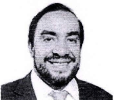
12. LESCANO ANCIETA, YONHY (Acción Popular)