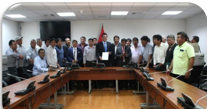
Reunión con los representantes de los transportistas de vehículos de la categoría M1 Y M2