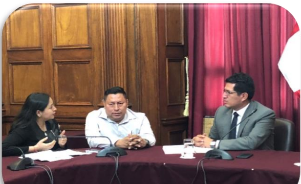
Reunión con los representantes de los medios de Yurimaguas