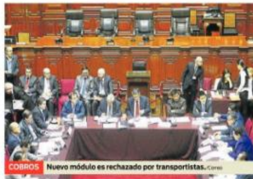
COBROS Nuevo módulo es rechazado por transportistas.

PRONUNCIAMIENTO. Sin embargo, ayer el Ministerio de Transportes emitió un comunicado en el que instó a OSITRA a declarar la inmediata suspensión de obligaciones