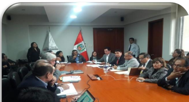
Mesa de trabajo problemática de la carretera central junto a las autoridades del Poder Ejecutivo