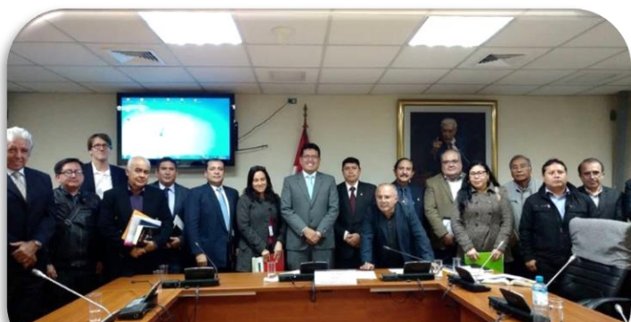
Reunión con los representantes de los transportistas de vehículos de la categoría M1 Y M2