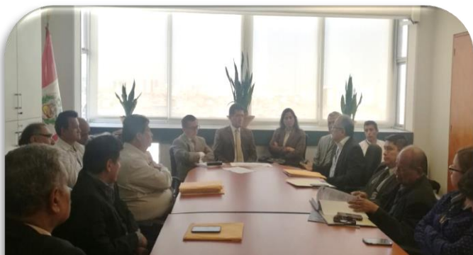
Reunión en la Director General de Transporte Terrestre del Ministerio de Transportes, junto a los transportistas del Norte del país