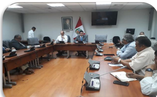
Atención a los representantes de vehículos de la categoría M3