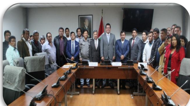
Atención a los transportistas de la región Ayacucho