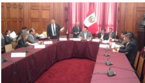
Por mayoría, esta mañana, Comisión de Transporte aprobó la medida.