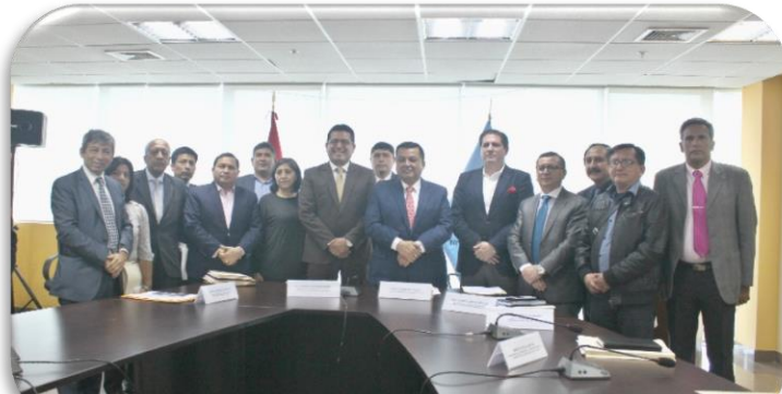
Mesa técnica respecto a la creación de la Autoridad de Transporte Urbano para Lima y Callao (ATU), con la participación de diversos funcionarios y especialistas del sector transporte.