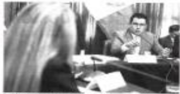
El proyecto de ley de Autoridad Única de Transporte Urbano.

La Comisión de Transportes del Congreso aprobó la Ley de Autoridad Única de Transporte Urbano.