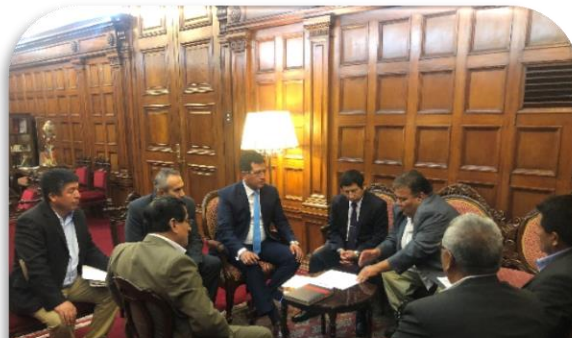
Con el fin de buscar una solución concreta a la problemática del transporte en el norte del país, nos reunimos con el ministro de Transportes y Comunicaciones, Elmer Trujillo, transportistas de Piura y Trujillo.