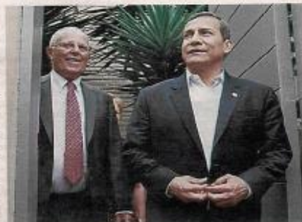
Descubren farra publicitaria de Humala y PPK.

Información se basa en un reporte de la Presidencia del Consejo de Ministros.