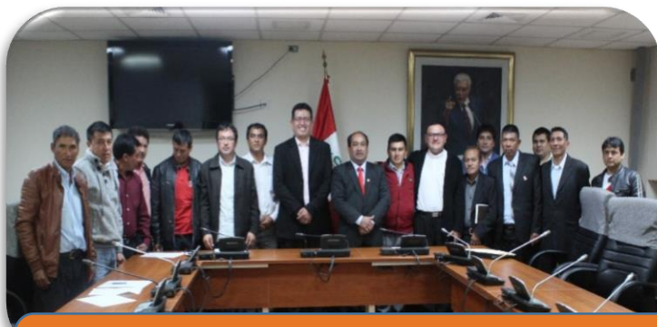
Transportistas Cuervo- Cajamarca