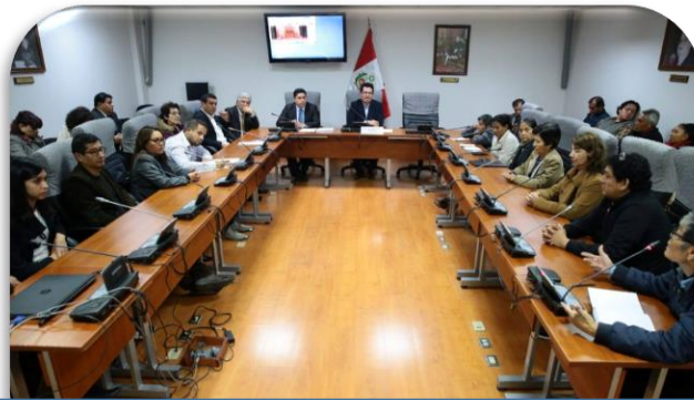
Reunión con los representantes de empresas de radiodifusión del interior del país