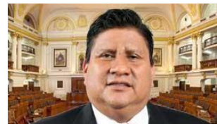
Glider Ushñahua Huasanga