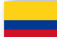
Ecuador, Bolivia, Chile y Colombia