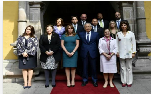
Grupo de Lima