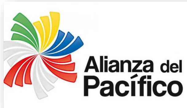
XIV Cumbre Presidencial de la Alianza del Pacífico