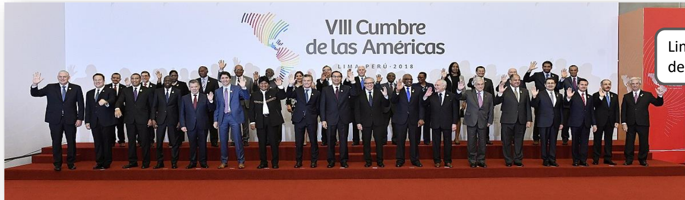
Lima, 13 y 14 de abril

Programa presupuestal N° 133 “Fortalecimiento de la Política Exterior y de la Acción Diplomática”