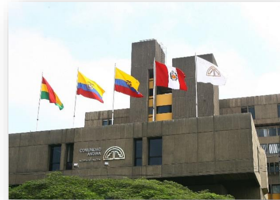
XX Consejo Presidencial de la Comunidad Andina

Gabinetes binacionales que se realizarán en el Perú: