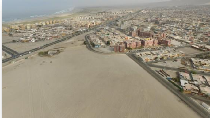
Construcción del complejo consular en el terreno “El Chinchorro” en Arica, Chile