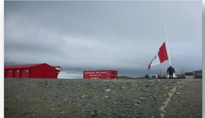
Construcción de estación científica del Perú en la Antártida