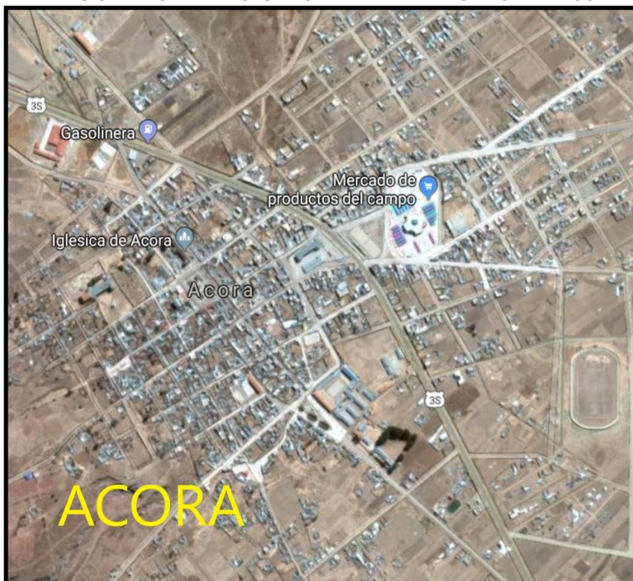
Imagen 02 AMBITO URBANO DE LA FUTURA CAPITAL DE LA PROVINCIA DE ACORA

Elaborado: Comisión de Descentralización