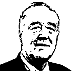
29. GARCÍA BELAÚNDE, VÍCTOR ANDRÉS (Acción Popular)