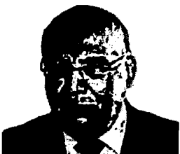
10. VILLAVICENCIO CÁRDENAS, FRANCISCO (Fuerza Popular)