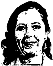
1. BARTRA BARRIGA, ROSA MARÍA Presidenta (Fuerza Popular)