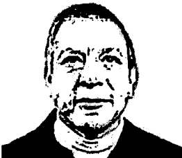
2. ARANA ZEGARRA, MARCO ANTONIO Vicepresidente (Frente Amplio por Justicia, Vida y Libertad)