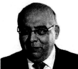
10. VILLAVICENCIO CÁRDENAS, FRANCISCO (Fuerza Popular)