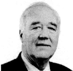
29. GARCÍA BELAÚNDE, VÍCTOR ANDRÉS (Acción Popular)