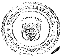
ALBERTO DE BELAUNDE DE CARDENAS Congresista de la República