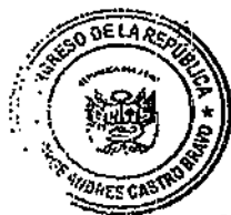
JORGE ANDRÉS CASTRO BRAVO Congresista de la República