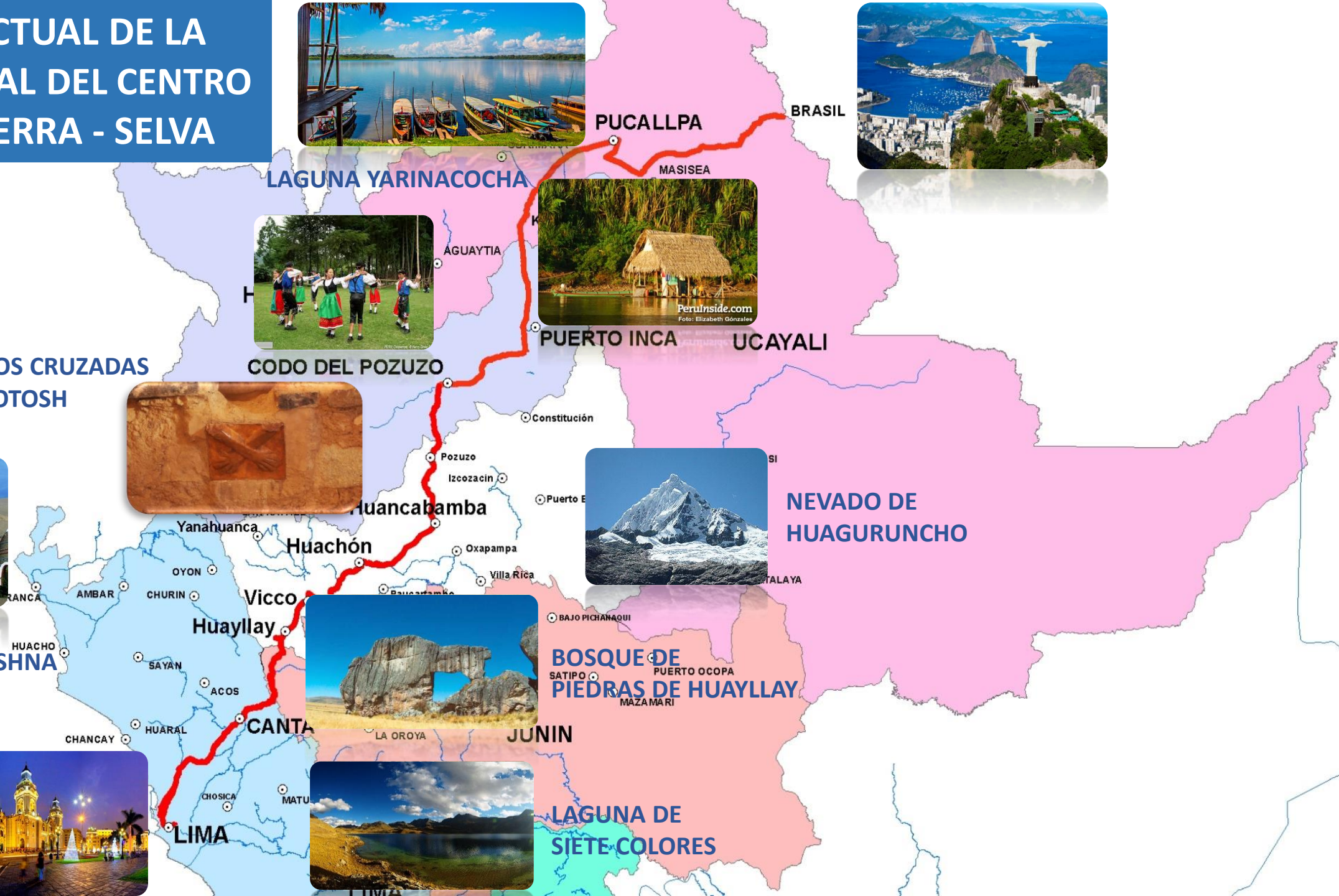
ECO TRULY PARK HUARAL HARE KRISHNA