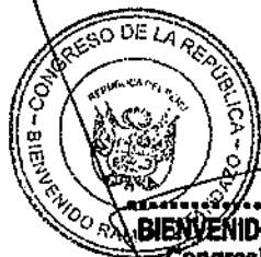
BIENVENIDO RAMIREZ TANDAZO Congresista de la República