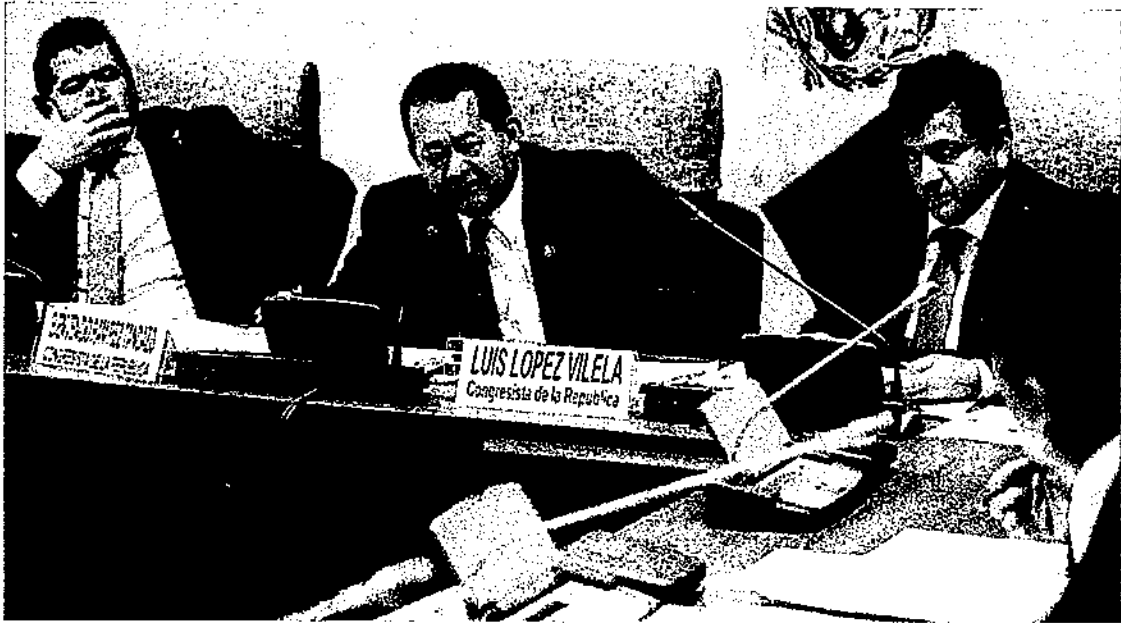
Sesión del Grupo de Trabajo encargado de Fiscalizar los Procesos de Contrataciones de Bienes, Servicios y Obras en los Gobiernos Locales, dirigida por el congresista Bienvenido Ramírez. Asisten los parlamentarios Carlos Domínguez y Luis López Vilela. (06/06/2017)