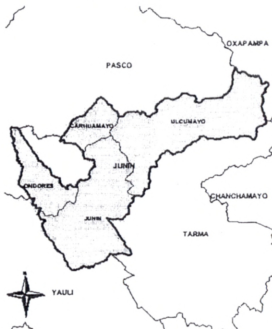
Región Junín, distrito Carhuamayo

En la toponomástica lugareña, Carhuamayo, posiblemente debido a los sedimentos subterráneos del río que le da su nombre y le sirve de límite, significa: QARHUA: amarillo; MAYO; río= Río Amarillo, es decir Carhuamayo significa RIO AMARILLO. 1