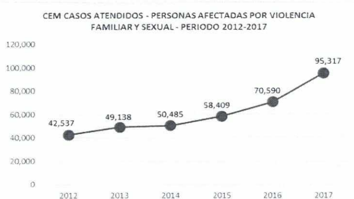
Gráfico N° 01