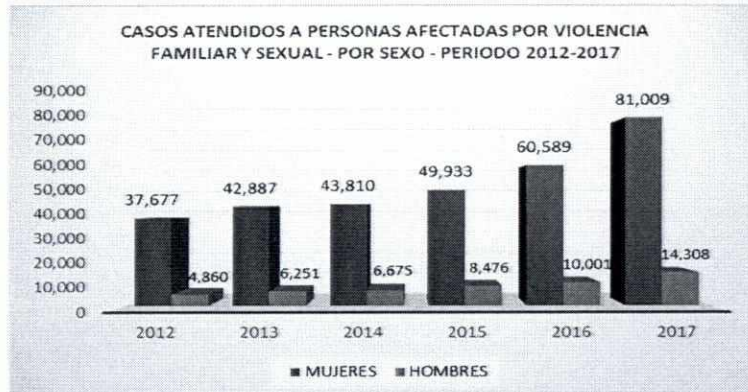
Cuadro N° 01