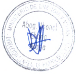
PERCY VELARDE ZAPATER DIRECTOR GENERAL DE HIDROCARBUROS MINISTERIO DE ENERGÍA Y MINAS