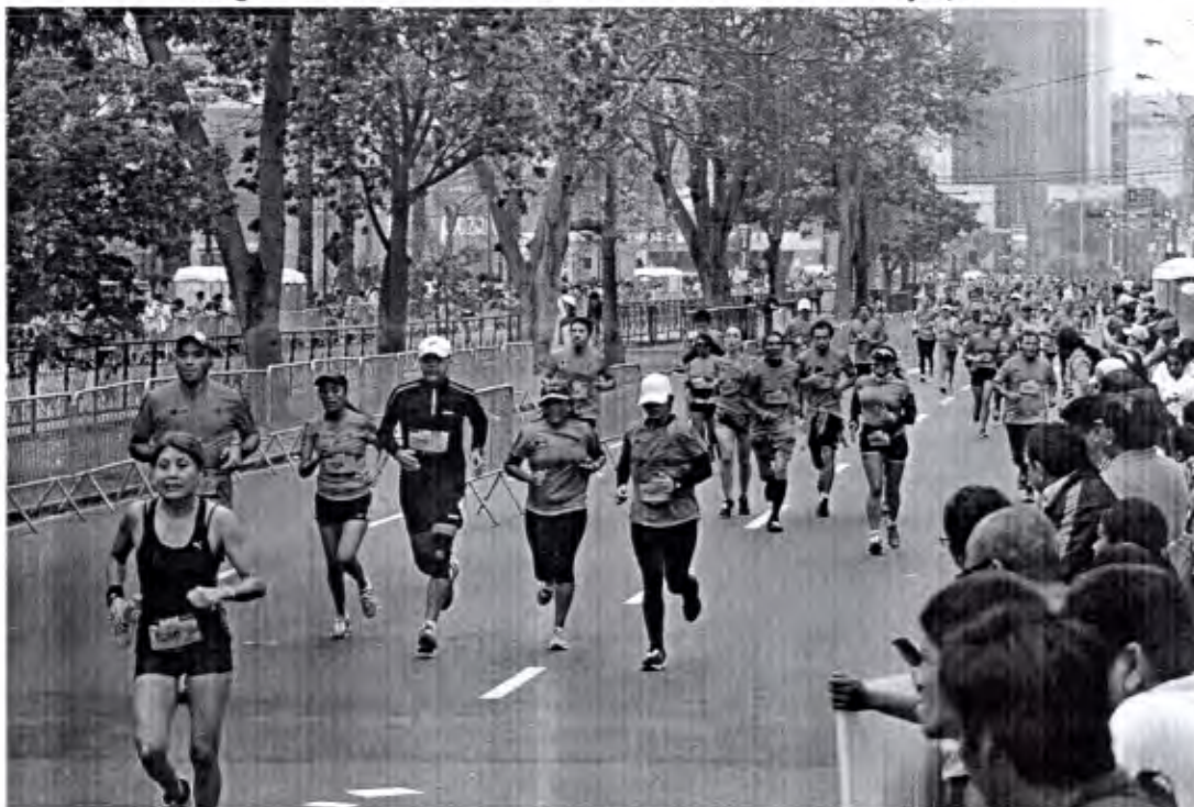
Imagen 4: Maratón Lima 42K en la Avenida Canaval Moreyra, 2016

3.12. El Tarifario de Servicios No Exclusivos de la Municipalidad de San Isidro 8 , aprobado mediante la Resolución de Gerencia Municipal N° 272-2015-0200-GM/MSI, permite generar ingresos estableciendo tarifas para actividades como las "Fiestas infantiles en parques", "Caminatas, carreras y/o maratones y otros con fines deportivos" y "Ferias y/o Exposiciones" que pueden realizarse al aire libre en el distrito. Esto permite no solo el ingreso de recursos sino también la dinamización de los espacios públicos existentes a través de actividades y eventos temporales o periódicos sin alterar la infraestructura. En las siguientes imágenes se puede apreciar de eventos deportivos y comerciales: