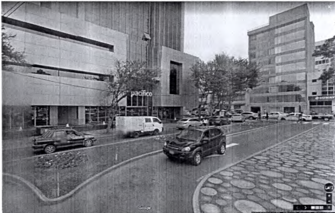
Imagen 2: Antes y después del parque Arona, octubre – diciembre 2015

espacios de recreación a los ciudadanos de forma oportuna. De esta manera la Municipalidad de San Isidro viene incrementando la dotación de espacio público en el distrito acondicionando las calles a nuevas funciones orientadas a la recreación.