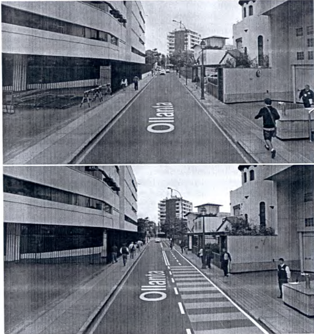
Imagen 1: Antes y después de la cuadra 1 de la calle Ollanta, julio – diciembre 2015

De acuerdo a la Evaluación del PEI 2015 5 , la multifuncionalidad del espacio público se viene logrando con la implementación de 15.7 km de ciclovías de un total de 55 km planificados (Plan de Movilidad Urbana Sostenible 6 ) a finales de 2015. Ver las siguientes imágenes que muestran la ciclovía en la calle Ollanta permitiendo que los ciclistas circulen de forma segura.