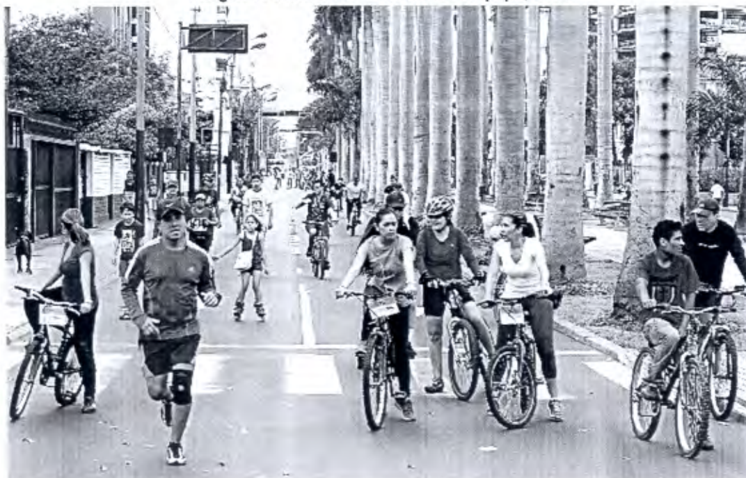
Imagen 6: Ciclodía en la avenida Arequipa, 2016

Asimismo, la avenida Arequipa, de competencia metropolitana, viene realizando, desde hace 2 gestiones municipales, el "Ciclodía" todos los domingo con el cierre temporal de 8 am a 1pm permitiendo que las familias del distrito y Lima en general cuenten con más espacios públicos de forma oportuna en un horario acorde a las rutinas familiares. Ver la siguiente imagen: