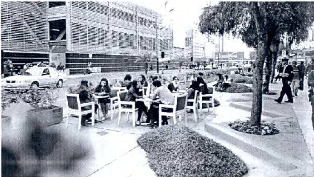
Imagen 8: Calle Las Begonias cuadra 6, 2016