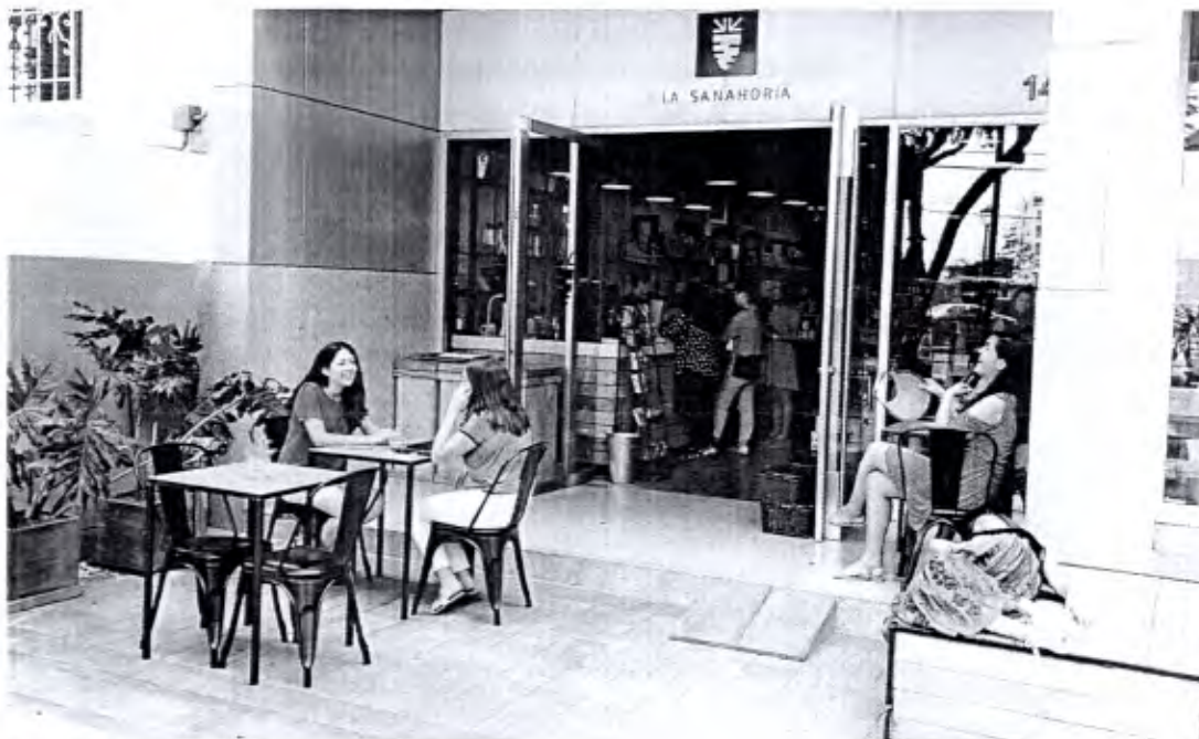
Imagen 9: Calle Las Libertadores cuadra 1, 2016