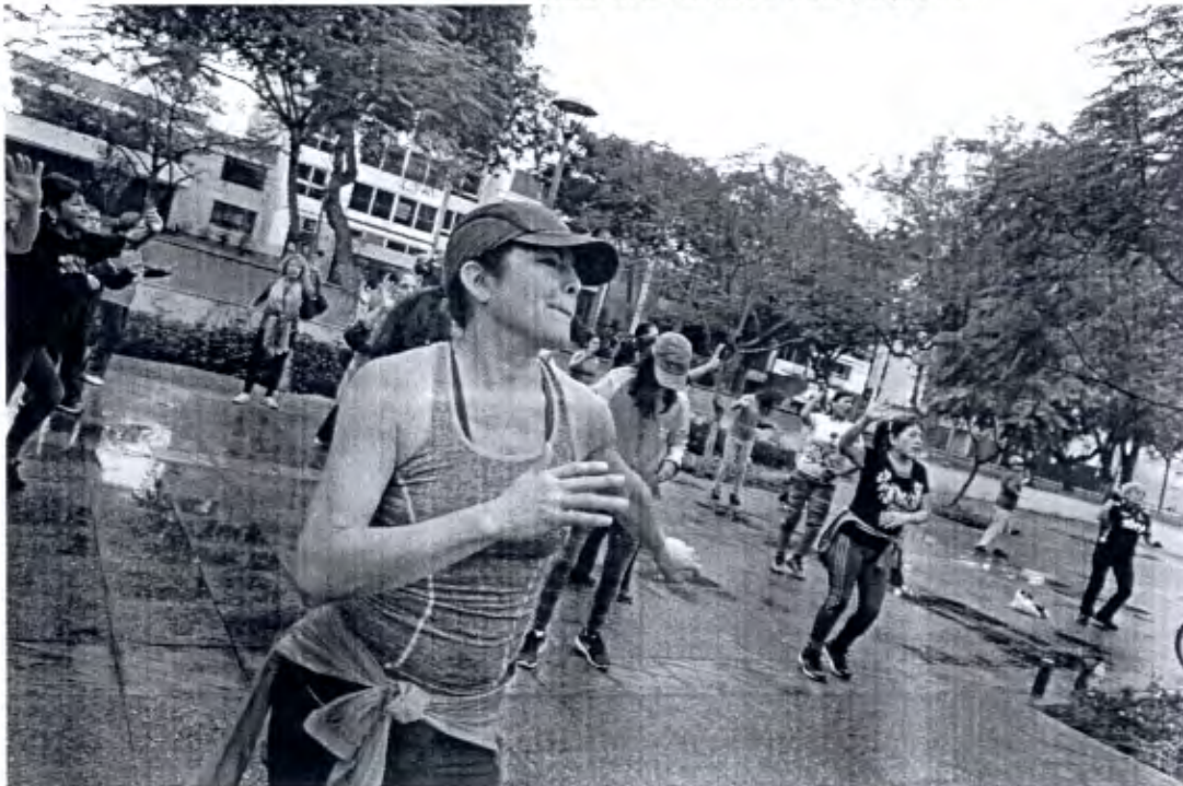
Imagen 13: Sábado de Zumba en la avenida Carriquiry, 2016