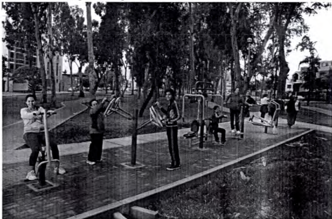
Imagen 11: Minigimnasios en la avenida Del Parque Sur, 2015