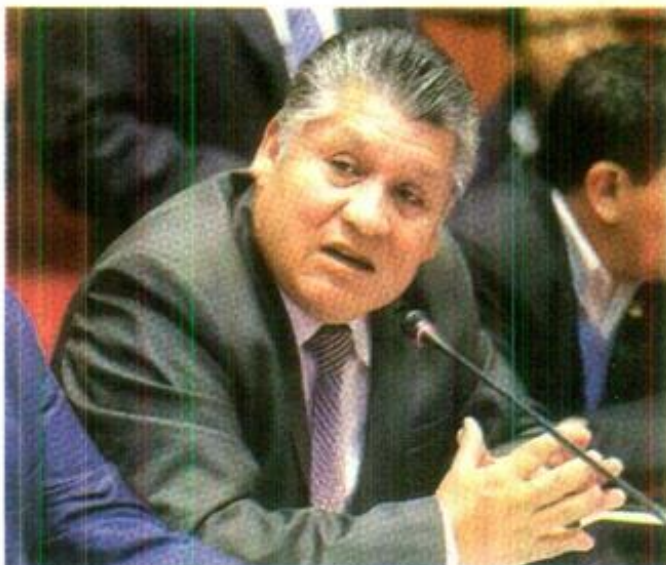
Legislador dijo que se busca condiciones de igualdad.