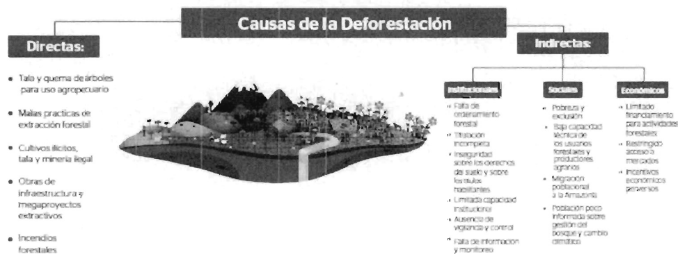
Gráfico 5.9 Causas de la deforestación