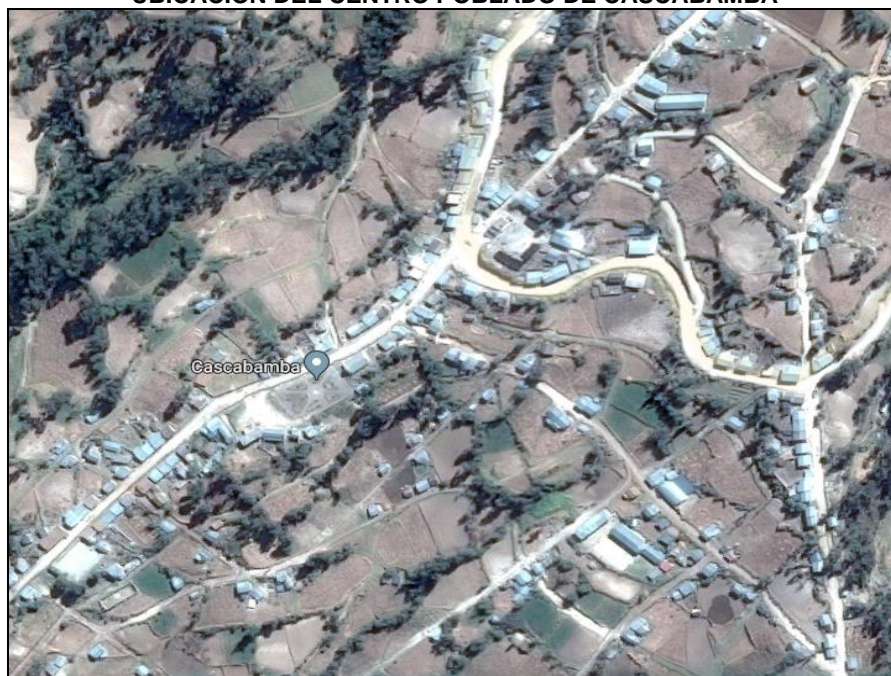
Imagen 02 UBICACIÓN DEL CENTRO POBLADO DE CASCABAMBA

Elaborado: Comisión de Descentralización