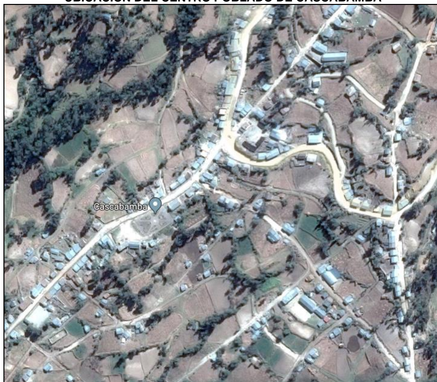
Imagen 02 UBICACIÓN DEL CENTRO POBLADO DE CASCABAMBA

Elaborado: Comisión de Descentralización