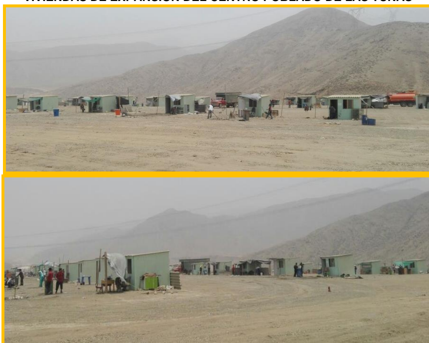
Imagen 4 VIVIENDAS DE EXPANSIÓN DEL CENTRO POBLADO DE LAS TUNAS