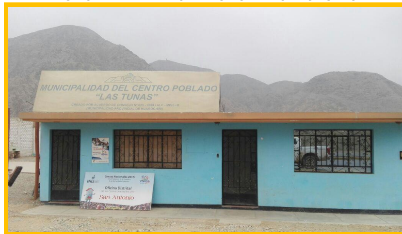
IMAGEN 03 MUNICIPALIDAD DEL CENTRO POBLADO LAS TUNAS

Elaboración: Comisión de Descentralización