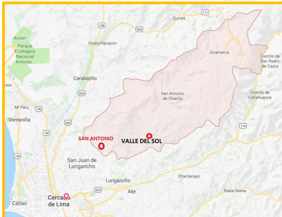
Imagen 2 MAPA DE UBICACIÓN DEL DISTRITO VALLE DEL SOL.

Se trata de una propuesta de creación de un distrito en área que tiene ámbito de costa y sierra hasta más de 3.200 m.s.n.m. es decir es un ámbito del distrito de San Antonio , provincia de Huarochirí, en el departamento de Lima. Véase Imagen 2. Ubicación del futuro distrito.