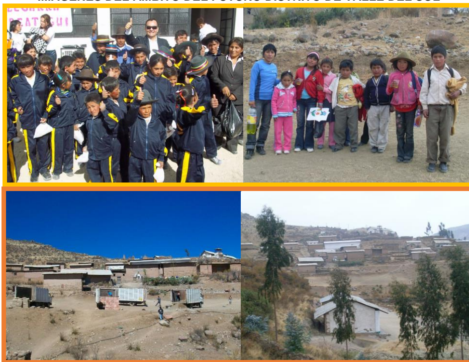
Imagen 1 IMÁGENES DEL ÁMBITO DEL FUTURO DISTRITO DE VALLE DEL SOL