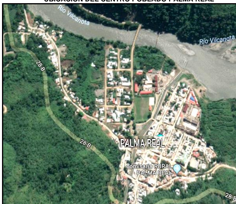
Imagen 02 UBICACIÓN DEL CENTRO POBLADO PALMA REAL

Elaboración: Comisión de Descentralización