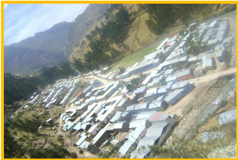
Imagen: Imagen panorámica del Centro Poblado de Chinche.