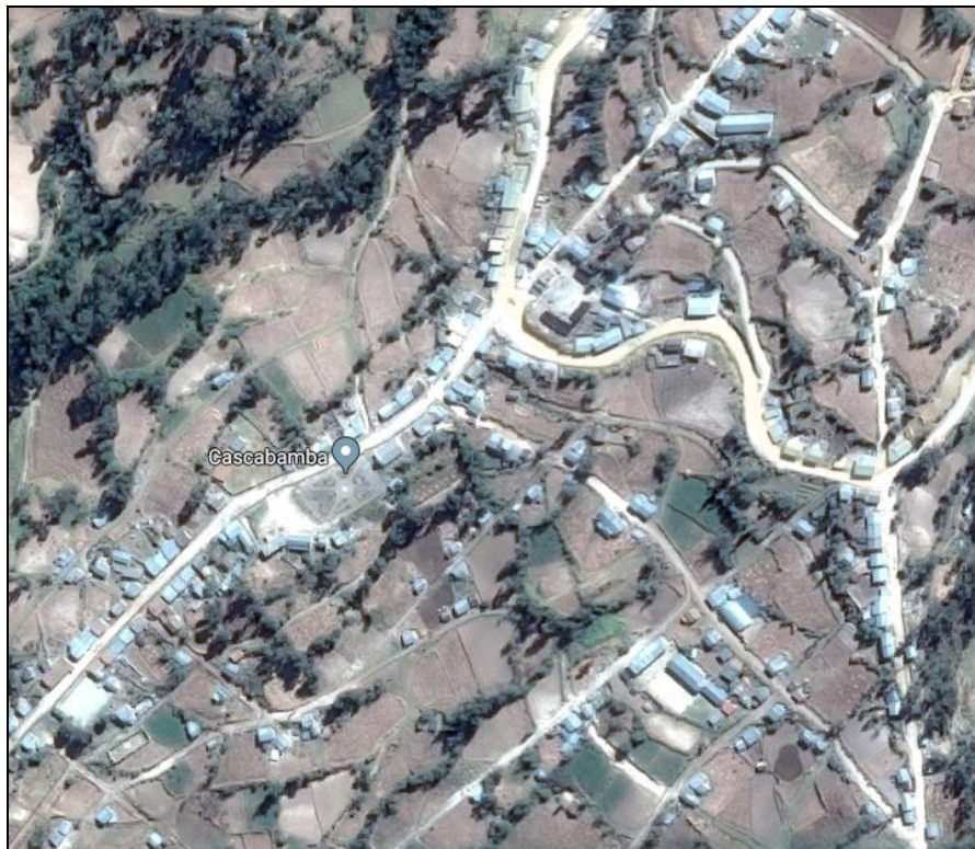
Imagen 02 UBICACIÓN DEL CENTRO POBLADO DE CASCABAMBA

Elaborado: Comisión de Descentralización